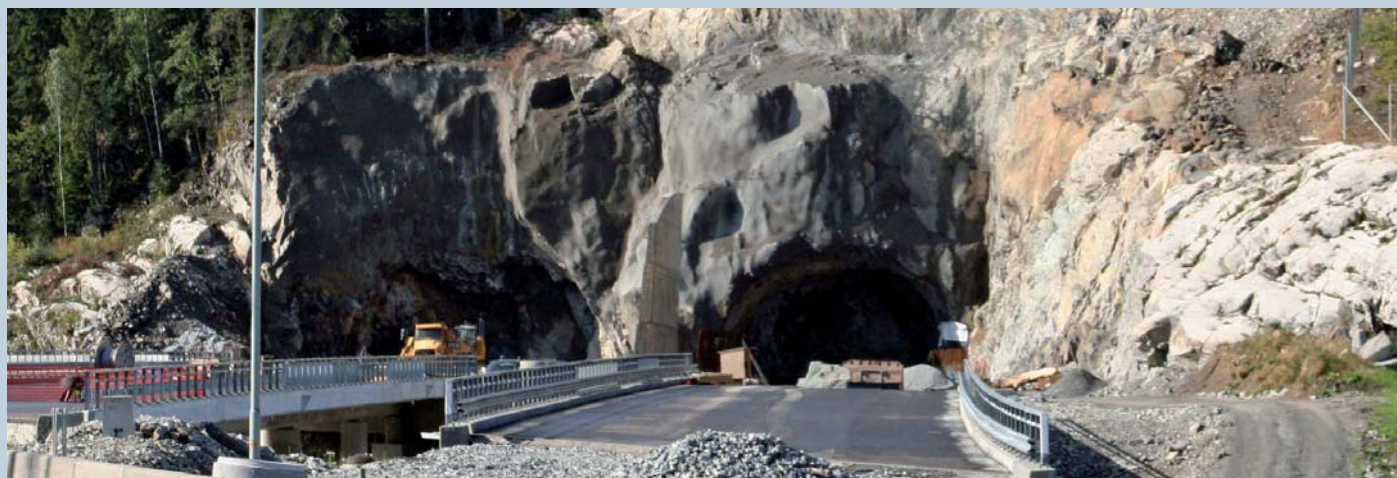
Motorveibrua i Assurdalen Om ett år går trafikken over den nybygde motorveibrua og inn Nøstvet-tunnelen.

Nordøst i prosjektet, i Assurdalen på høyde med Regnbuen industrifelt – er det bygget en motorveibru mot tunnel-åpningen. Den nye vegbanen for nordgående trafikk (mot Ryen) er ferdig bygget. I oktober legges trafikken hit. Mens det sørgående løpet opparbeides til motorveistandard, går det tovegs trafikk på den nye vegbanen – altså med ett kjørefelt i hver retning.