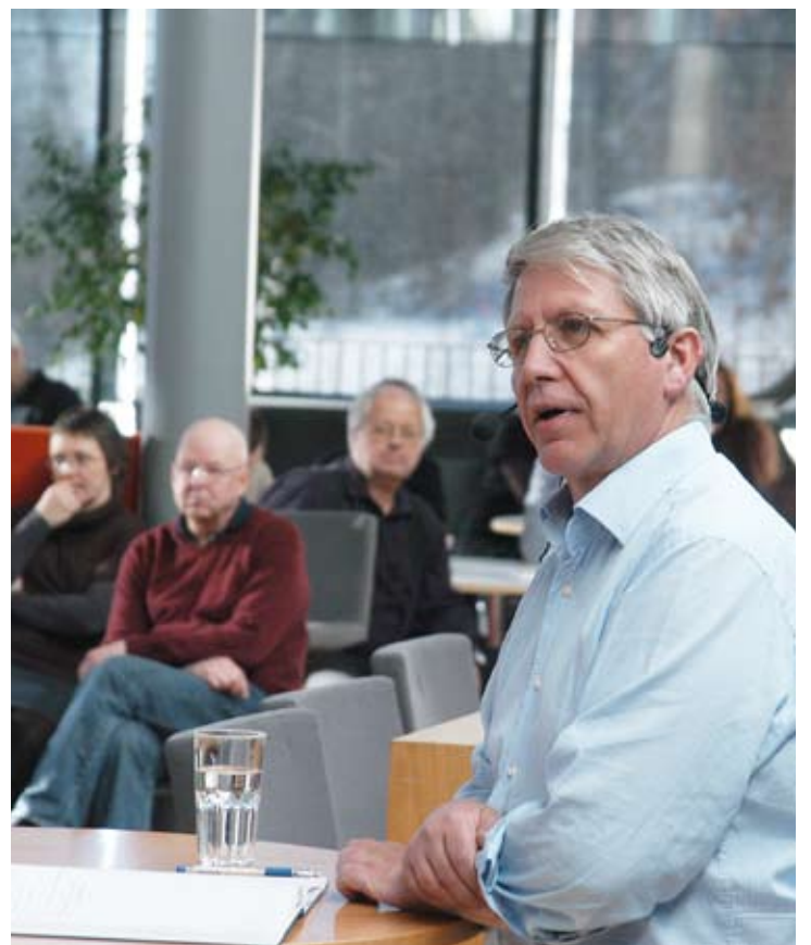
Går nye veier: Statens vegvesen vil miste mye arbeidskraft i årene fremover, og søker nå grupper som tradisjonelt sliter på arbeidsmarkedet.

– Vi kan tilby muligheten til å jobbe med viktige samfunnsoppgaver som gir muligheter for å påvirke samfunnet vi lever i. Det er dessuten gode arbeidsforhold og et godt arbeidsmiljø her, synes han. Selv om Vegvesenet ikke kan konkurrere i lønnsstoppen i vekstperioder, er det likevel mange som foretrekker å bli i etaten. Selv ikke i fjor var det noe stor flukt fra