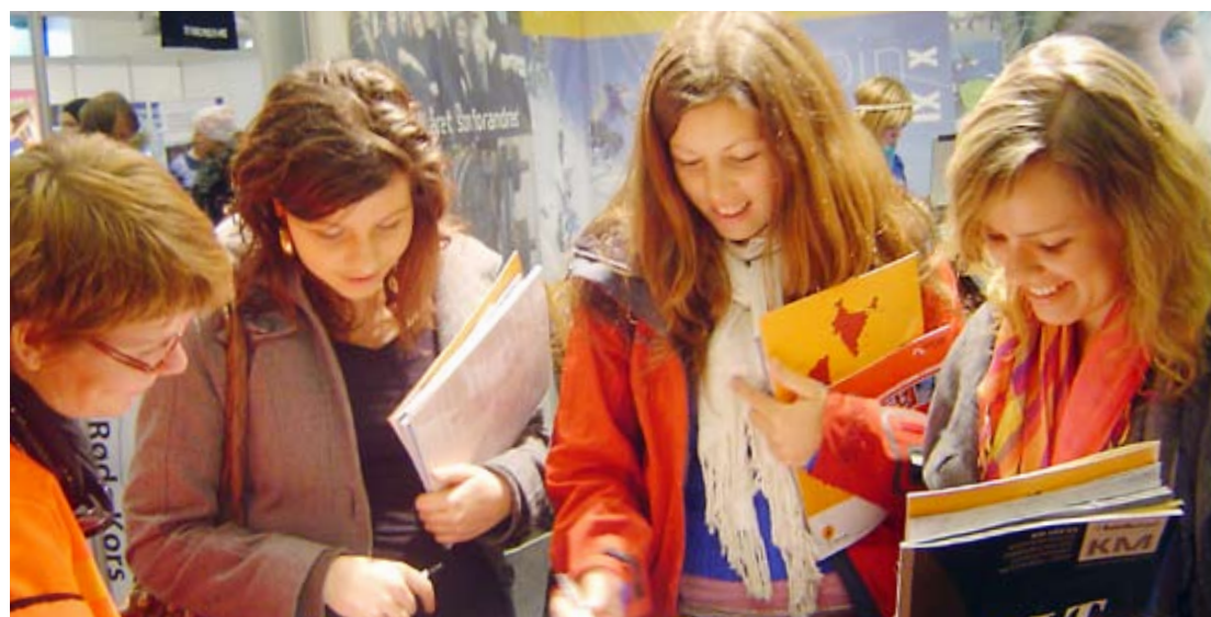
Mye på messer: Statens vegvesen har allerede deltatt på flere utdanningsmesser i år. Her fra utdanningsmessa i Trondheim.

– Finnes det noen bedre attest for en arbeidsgiver enn at folk søker seg tilbake? spør han begeistret.