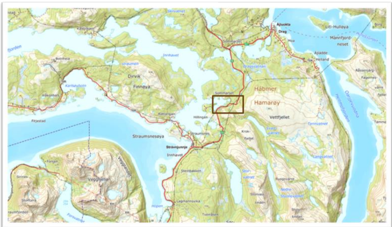
Figur 1: Planområdet ligger innenfor sort, markert ramme

Strekningen av E6 er ca 2,9 kilometer lang og starter i sør ved eksisterende steinbrudd rett nord for avkjøring til Hillingan på ca 5 m.o.h., krysser Svartvasselva og avsluttes etter passering av Merkforttjønna på ca 49 m.o.h.