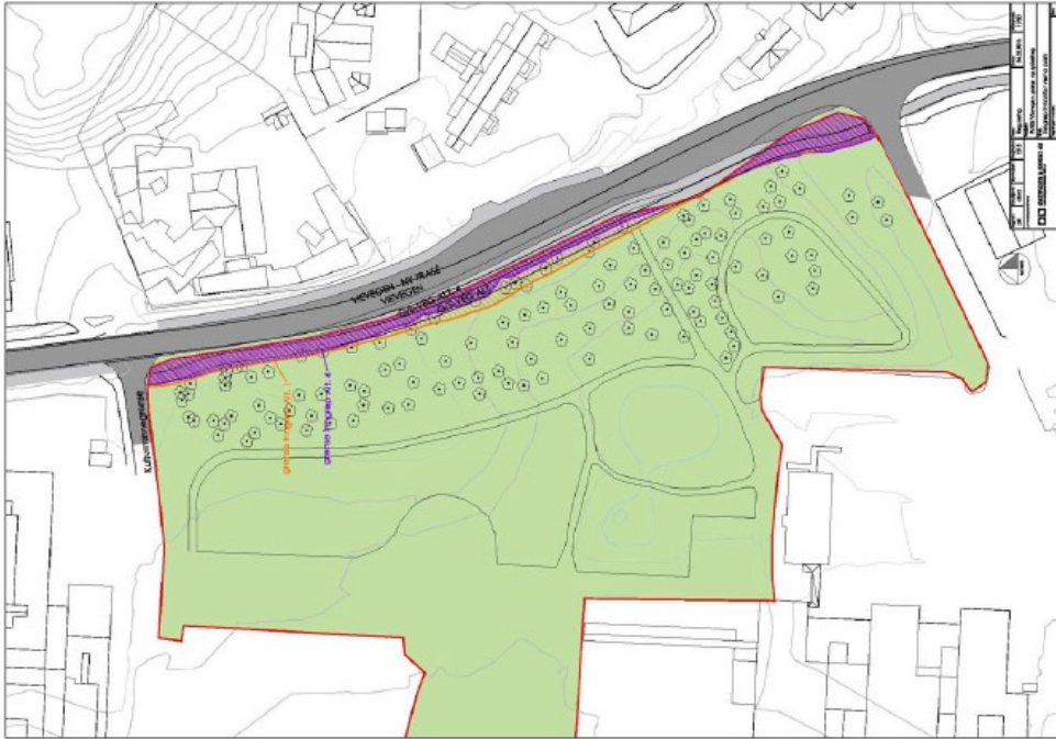
Arealoversikt (ill. Østengen og Bergo)

Sykkelhovudveg. I kommunedelplan trafikk Førde sentrum og i Førdepakken er det lagt til grunn ein sykkelhovudveg som ein samanhengande sykkelring som knyter saman den store arbeidsplassen som sjukehuset er, og dei store omkringliggjande bustadområda og sentrum i eit enkelt og lett oppfatteleg sykkelsystem. Sykkelbyen vart i denne planprosessen utfordra på om denne løysinga var nødvendig forbi sjukehusområdet. Sykkelbyen opprettheld tidlegare konklusjonar på dette, der dette vil vere den mest tilfredsstillande løysinga for sykkelsystemet. Det blir også teke omsyn til eksisterande løysingar nord og sør for nytt anlegg langs sjukehusområdet.