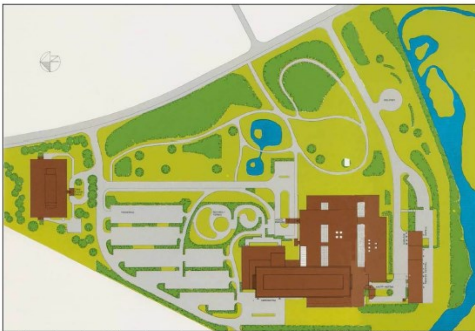
Landskapsplanen for sjukehusparken, teikna av landskapsarkitekt Arne Olav Moen i 1976.