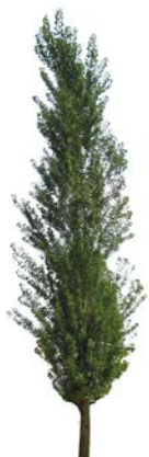
Svartpoppel Populus nigra 'Italica'