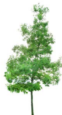
Sumpeik Quercus palustris