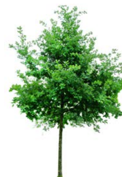
Vintereik Quercus petraea f.k. Agder