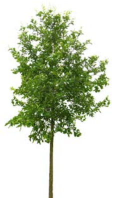
Rødeik Quercus rubra