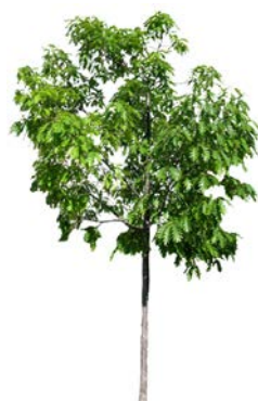
Frynseeik Quercus cerris