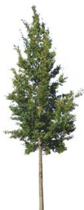
Osp Populus tremula