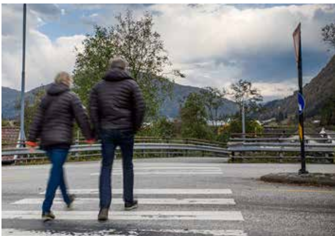
I og rundt Askvollkrysset vil det bli fleire endringar for dei gåande og syklande undervegs i prosjektet.