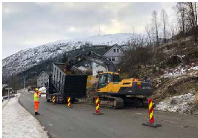
Anleggsarbeidet starta på fv. 609 i februar.