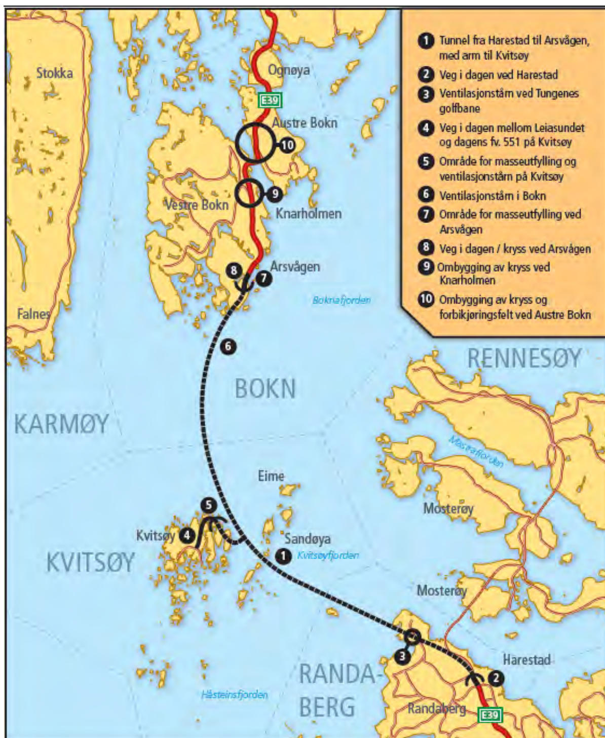
Figur 1. Tunneltrase og øvrige varslingsområder