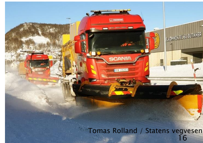
Tomas Rolland / Statens vegvesen 16