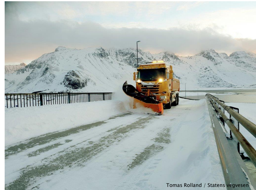
Tomas Rolland / Statens vegvesen