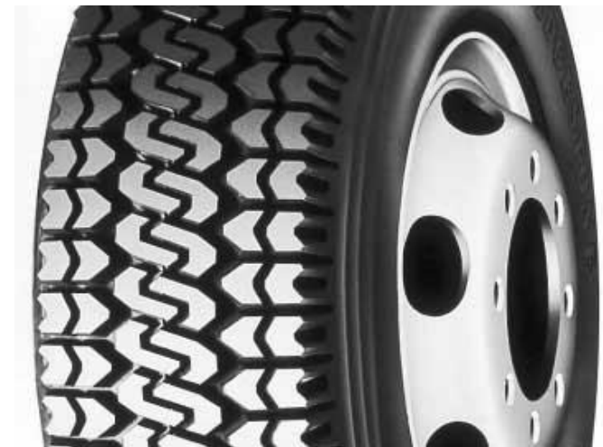
Mønsterdybde 5 mm

Krav til dekk på kjøretøy med tillatt totalvekt 3 500 – 7 500 kg skal ha vinterdekk på alle aksler 15. november til og med 31. mars Gjelder hele landet