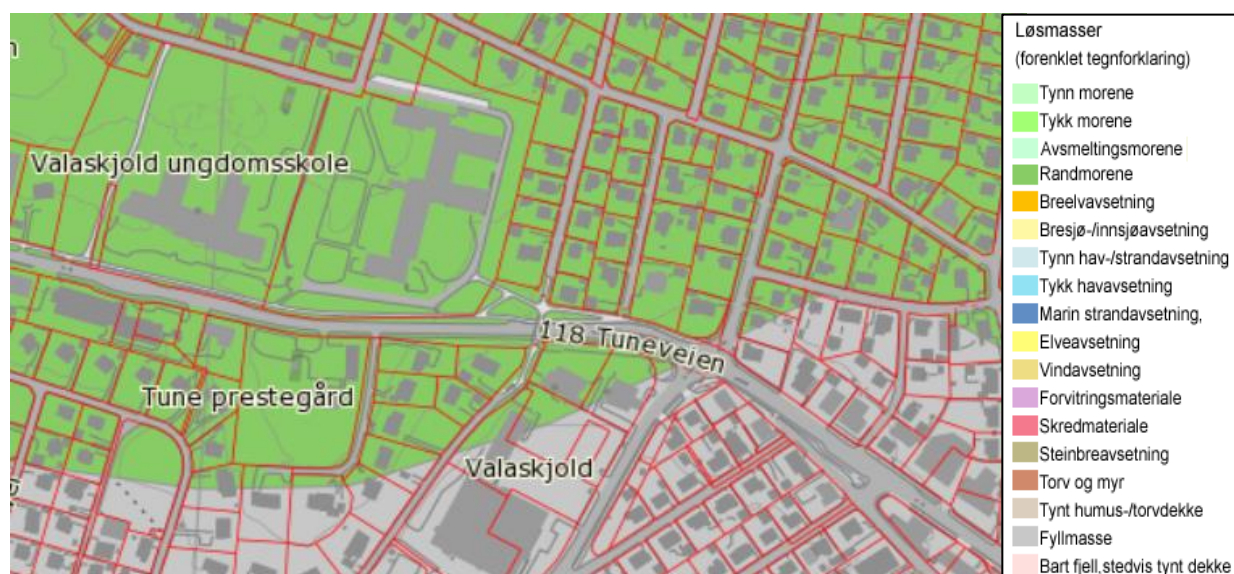
Figur 2: Kvartærgeologisk kart fra www.ngu.no

NGUs kvartærgeologiske kart (figur 2) viser randmorene omtrent fram til Vestrevei. Videre østover er det fyllmasser. Ved Kommunelageret er det delvis tynn hav/strandavsetning og områder med bart fjell/stedvis tynt dekke.