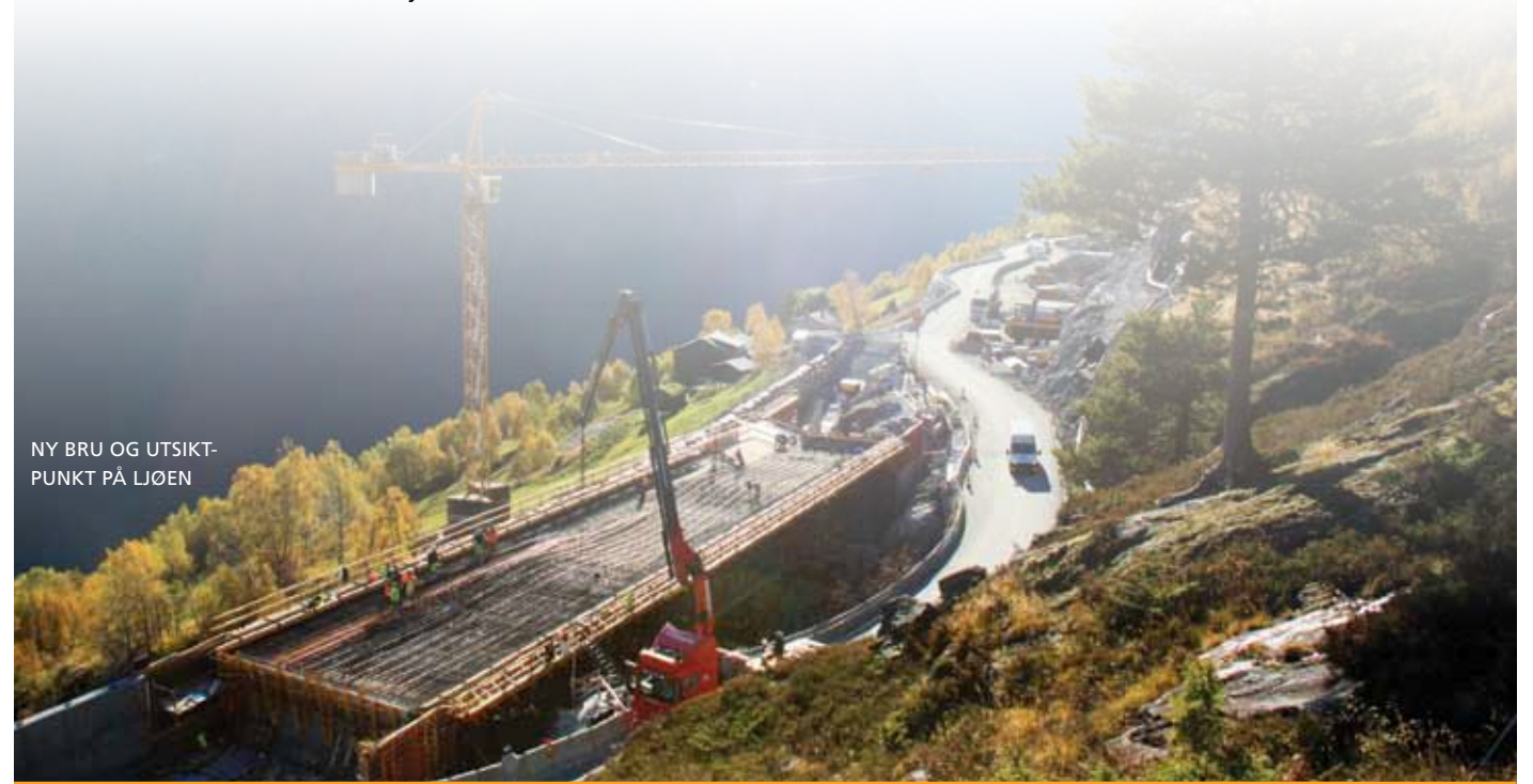
NY BRU OG UTSIKT-PUNKT PÅ LJØEN

Byggeplanlegginga starta sommaren 2012, og om Møre og Romsdal fylkeskommune løyver midlar kan tidlegast opning verte til vinteren 2015/2016.