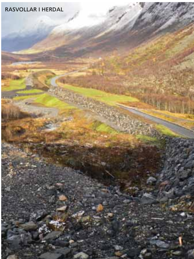
RASVOLLAR I HERDAL