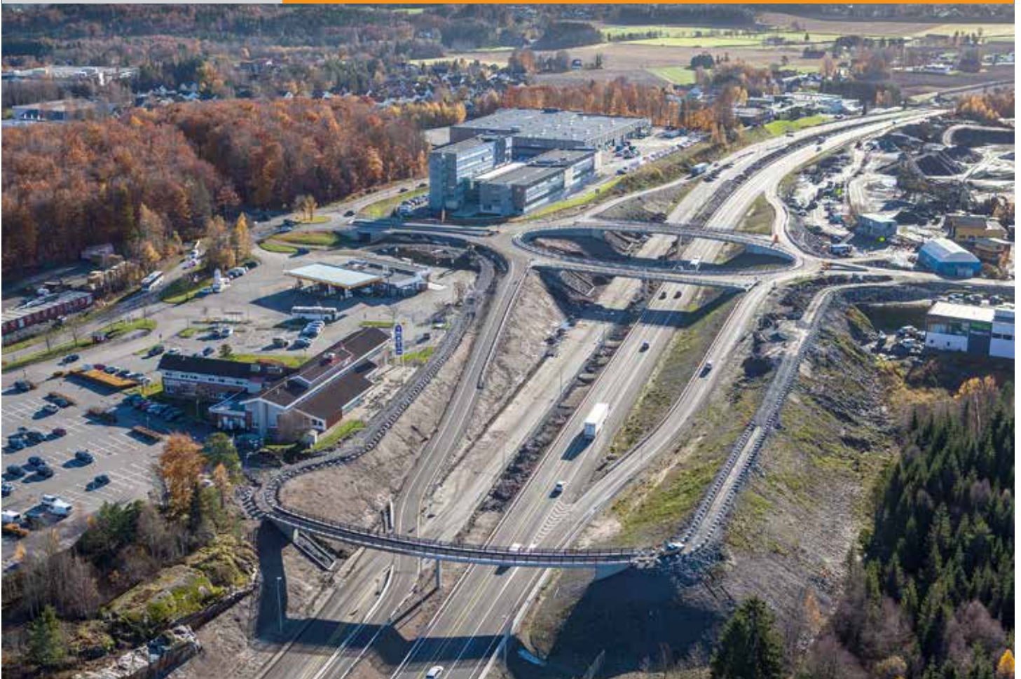
Fokserødkrysset sett sørover. I forgrunnen den nye Fokserød gang- og sykkelbru.

Fram mot jul vil det være stor aktivitet på strekningen fra Tassebekk til Langåker. Fra nyåret har entreprenøren Skanska Norge AS planlagt redusert aktivitet fram til slutten av april 2014. Arbeider som da skal gjøres ferdig er asfaltering, vegoppmerking og grøntarbeider. Elektroarbeider med trekking av kabler og oppsetting av variable skilt vil også gjøres ferdig i 2014. Vegen begynner allerede nå å se ferdig ut, men det er fortsatt mye arbeid igjen før nordgående løp kan tas i bruk.