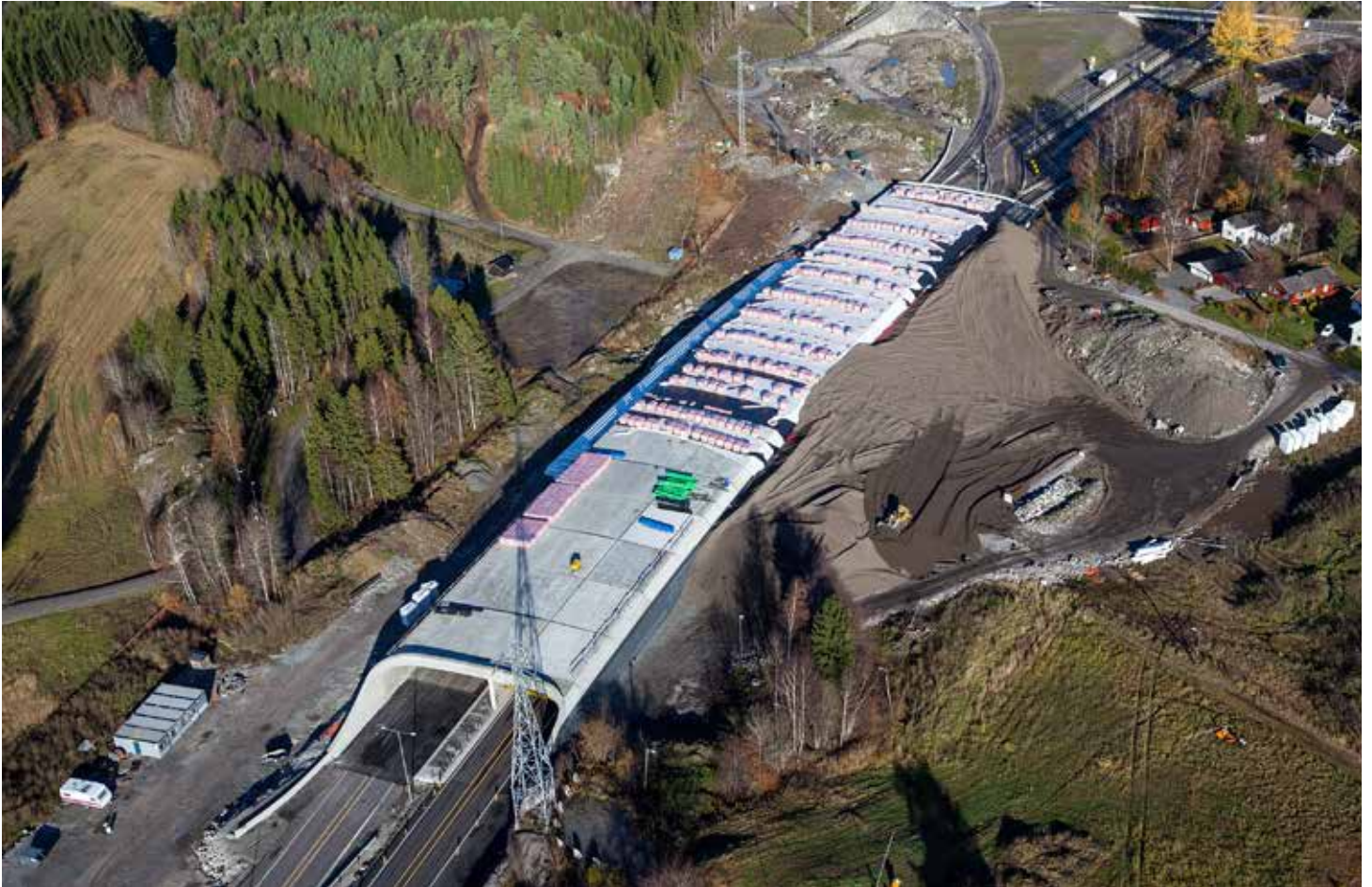
Natvall miljøtunnel sett mot nord. Det foregår utlegging av lecafylling på østsiden av miljøtunnelen.