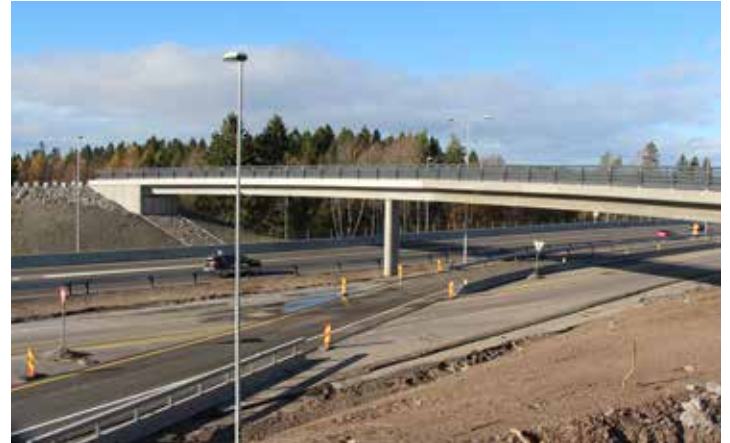
Den nye Fokserød gang- og sykkelbru blir tatt i bruk til våren.

Vi går mot siste vinter med anleggsdrift på E18 Gulli–Langåker. Gjennom hele vinteren vil trafikken gå med tovegstrafikk på sørgående løp. På strekningen er det ikke montert midtrekkverk. Statens vegvesen vil følge ekstra godt opp vintervedlikeholdet på strekningen med «Barvegstrategi» i hele vinter.