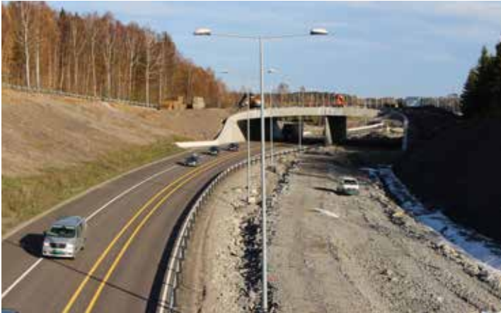
Tassebekk viltlokk sett nordover fra Hørdalsveien bru.