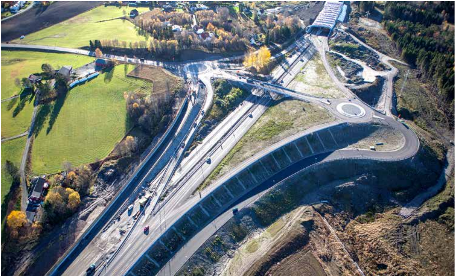
Natvallkrysset sett mot sør. Foto tatt før omlegging til sørgående løp.

den gamle rampen opp til Sandefjord innfartsveg. Den nye avkjøringsrampen skal bygges og tas i bruk i høst eller til våren, avhengig av værforholdene.