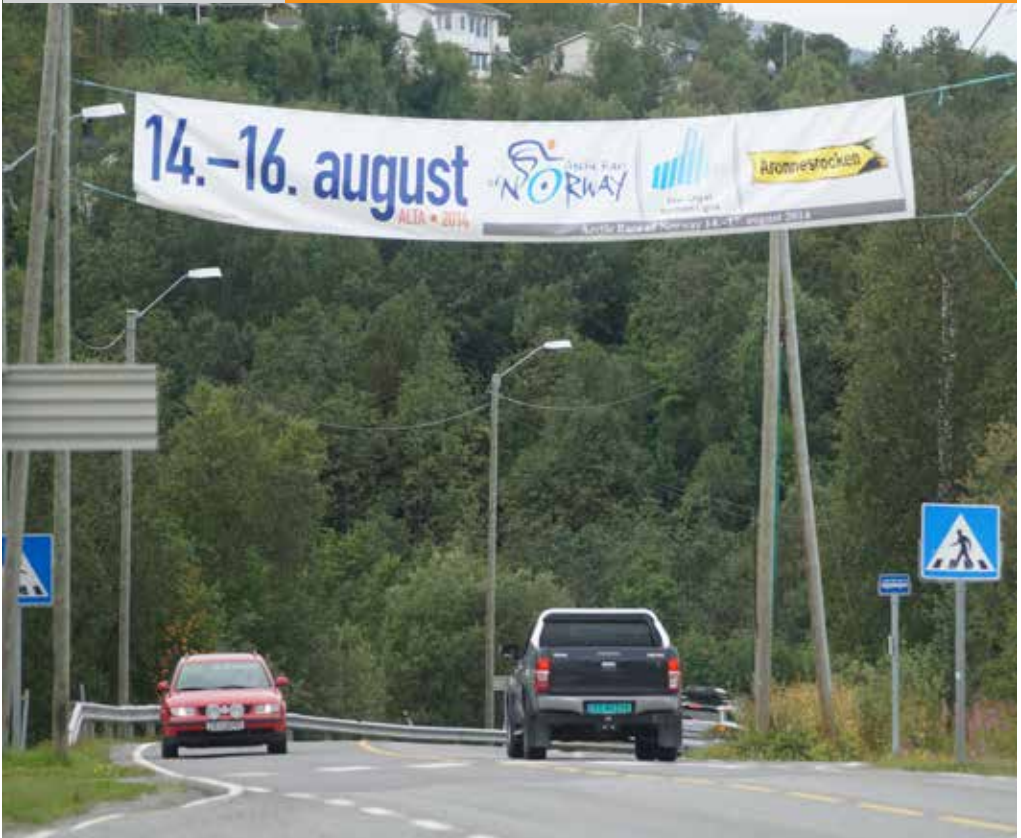
Ulovlig reklame ved gangfelt/bussholdeplass.

I denne brosjyren finner du informasjon om en del viktige bestemmelser som regulerer reklame langs offentlig veg.