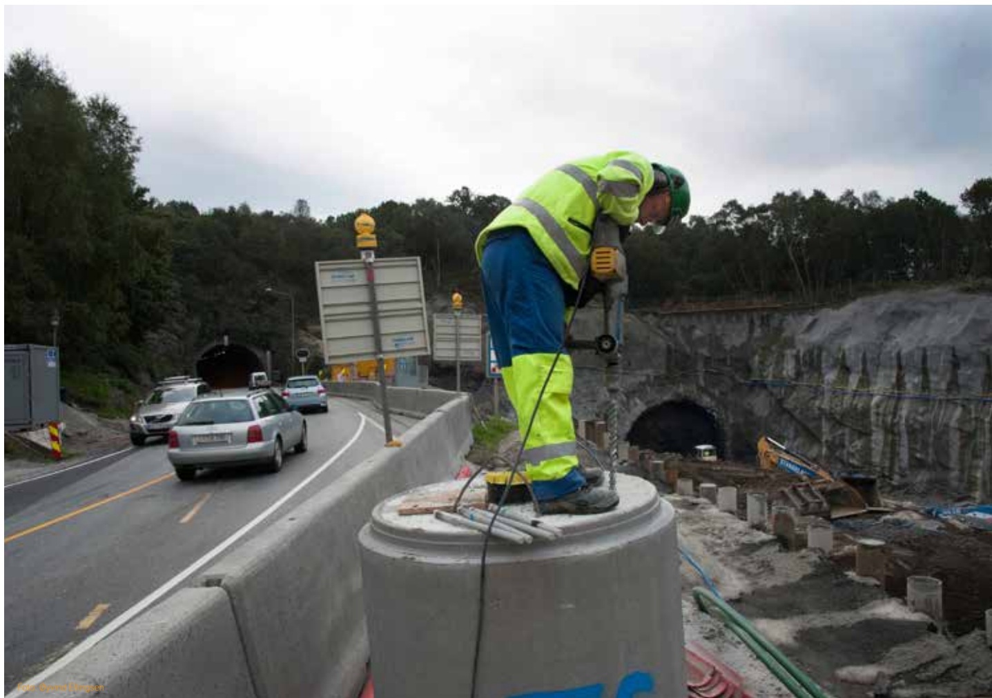
Det bores og graves ved innslaget for Eiganestunnelen på Tasta – samtidig som bilstene fortsatt kan kjøre gjennom Byhaugtunnelen. Når alt står ferdig vil den nye Eiganestunnelen gå fra Tasta til Schankehølen, med av og påkjøring til Stavanger sentrum. Dette via to tunneler som kommer opp i dagen ved St. Svithun-parken. Det vil også bli av og påkjøring via to tunneler, som kommer ut i dagslys bak Gamlingen.