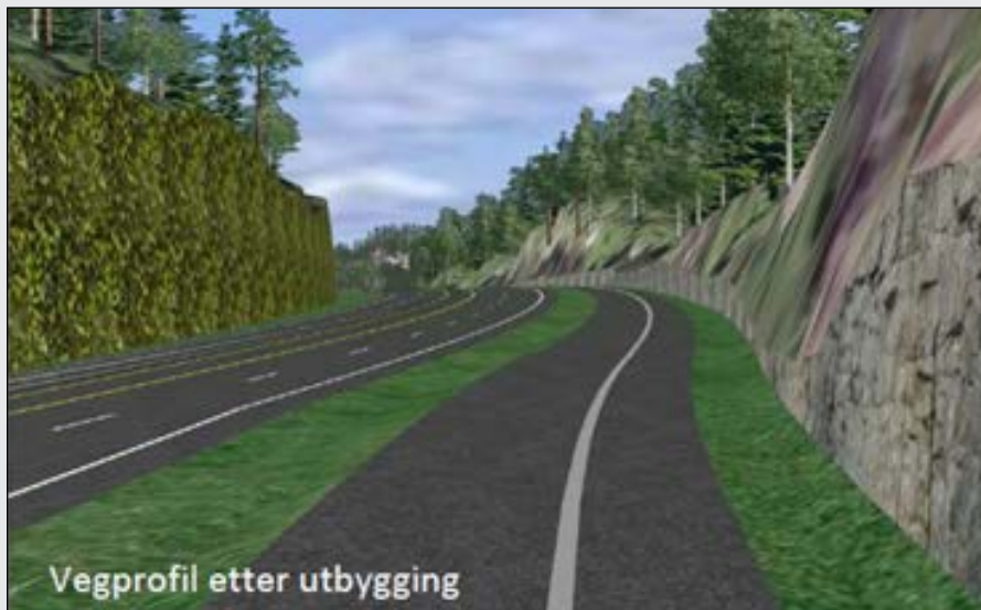
Vegprofil etter utbygging

Langs vegen ved Fidjemoen bygges eget fortau. Det bygges også egne fortau og gangveger som forbindelse til og fra bussholdeplassene.