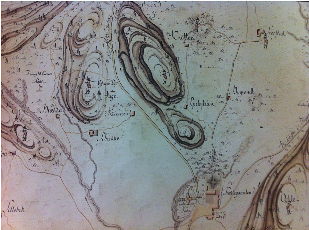
Kart fra 1801

Langs hele veistrekket finnes det fremdeles Brannhydranter. Dette er et sjeldent syn og disse må tas vare på. Brannvesenet i Sandefjord har en «verneplan»/bevisst holdning til bevaring av disse og det er derfor de fremdeles står.