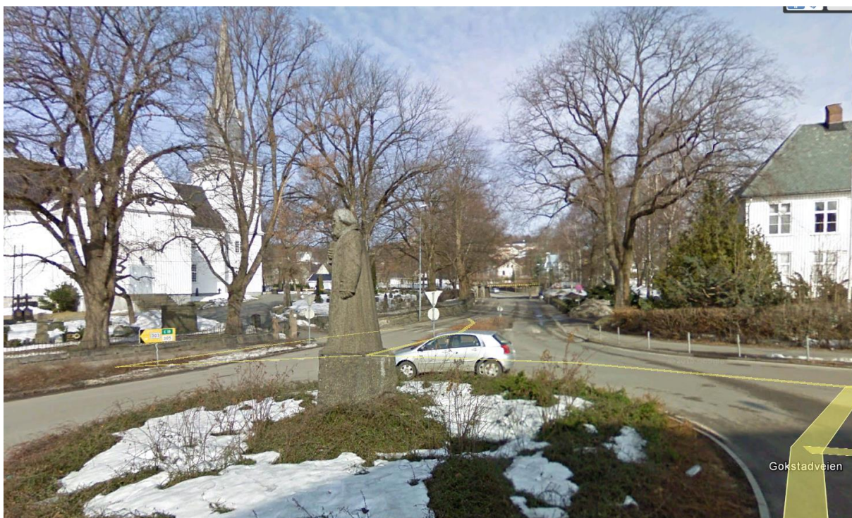
Landstadsmonumentet , Dølabakken, Sandar kirke og prestegården.

Vestfold fylkeskommune vil gjøre arkeologisk registrering på arealene på prestegårdssiden.