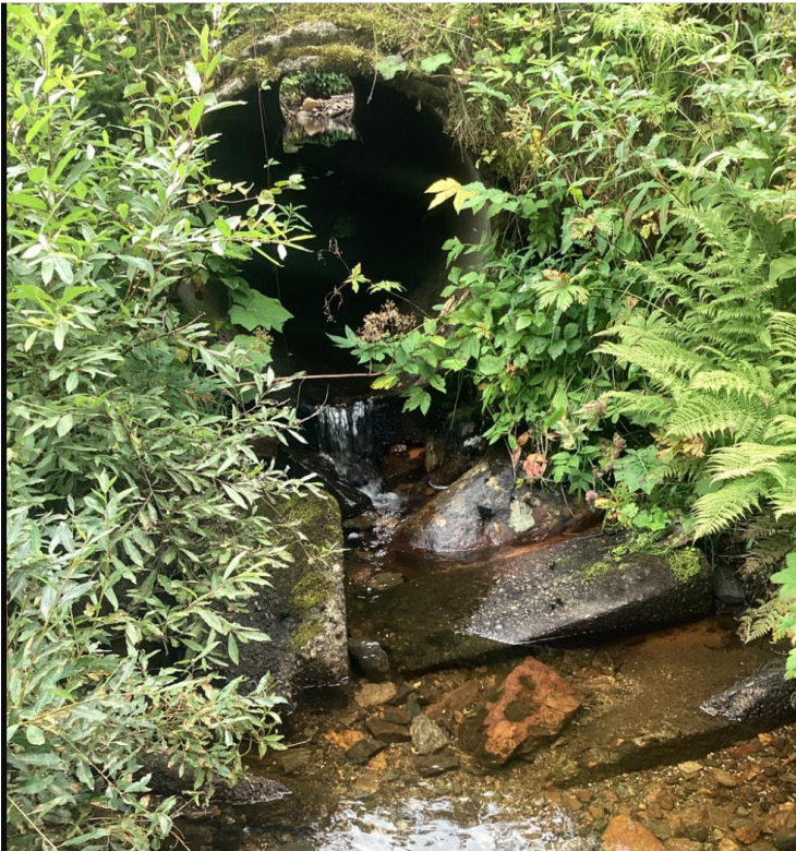
Figur 2 Utløp av rør under E6, bekk ved Fossheim

Vannprøveanalysene tyder på at dette er en bekk som er upåvirket, da de ulike parameterne viser naturlige nivåer.