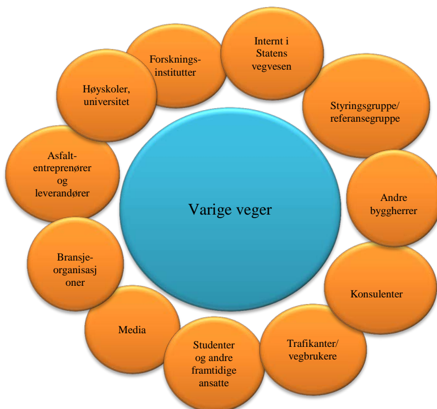
Figur 1 Målgrupper

Statens vegvesen har både gjennom sin størrelse og sitt sektoransvar påvirkning på mange, vegvesenets forskningsprogrammer vil derfor ha mange interessenter. Slik sett også med Varige veger.