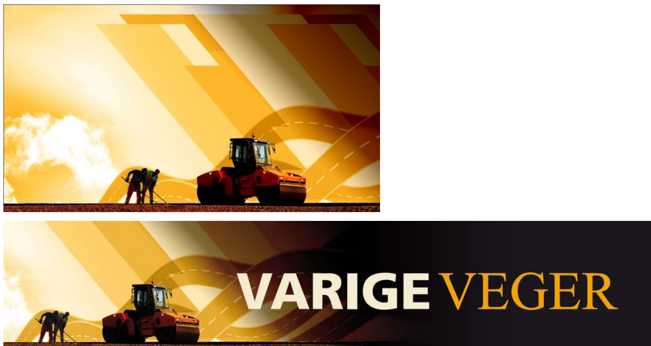
Figur 2 Profilbilde utviklet av Grafisk senter

Det har vært et samarbeid med Grafisk senter om utvikling av profil. Det har blitt laget et profilbilde som vil gå igjen i alle presentasjoner, profileringsartikler, rapporter, power point presentasjoner o.l. I tillegg er det laget en karakteristisk og gjenkjennelig måte å skrive «Varige veger» på som vil gå igjen.