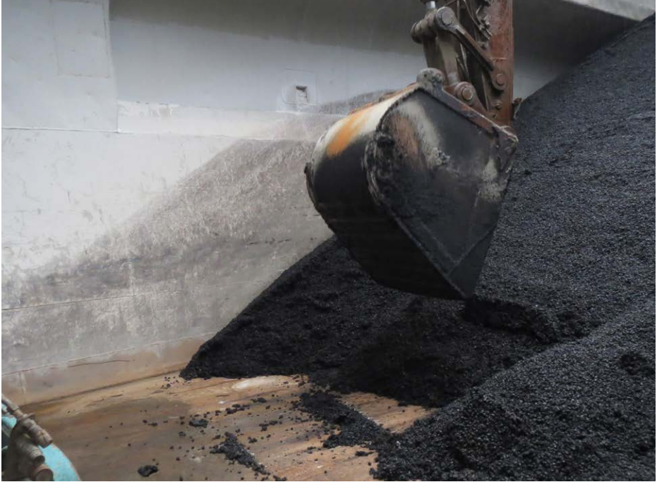
Figur 5: Godt arbeid med skuffen gir jevn temperatur på billasset.

Asfalt fra kantene av lasterommet må fordeles. Det bør ikke lastes mer enn én skuff asfalt med lavere temperatur per bil. Sørg for at den siste skuffen som lastes er fra midten av lasten.