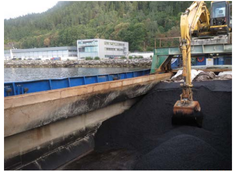
Figur 6: Kald masse som er samlet fra bunn og kanter må ikke lastes på bil.