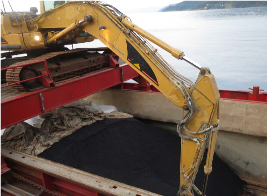
Figur 4: Avdekk lasten gradvis for å unngå varmetap.

Ved lossing av båt må lasten avdekkes trinnvis. Ved stopp i lossingen må lasten dekkes til.