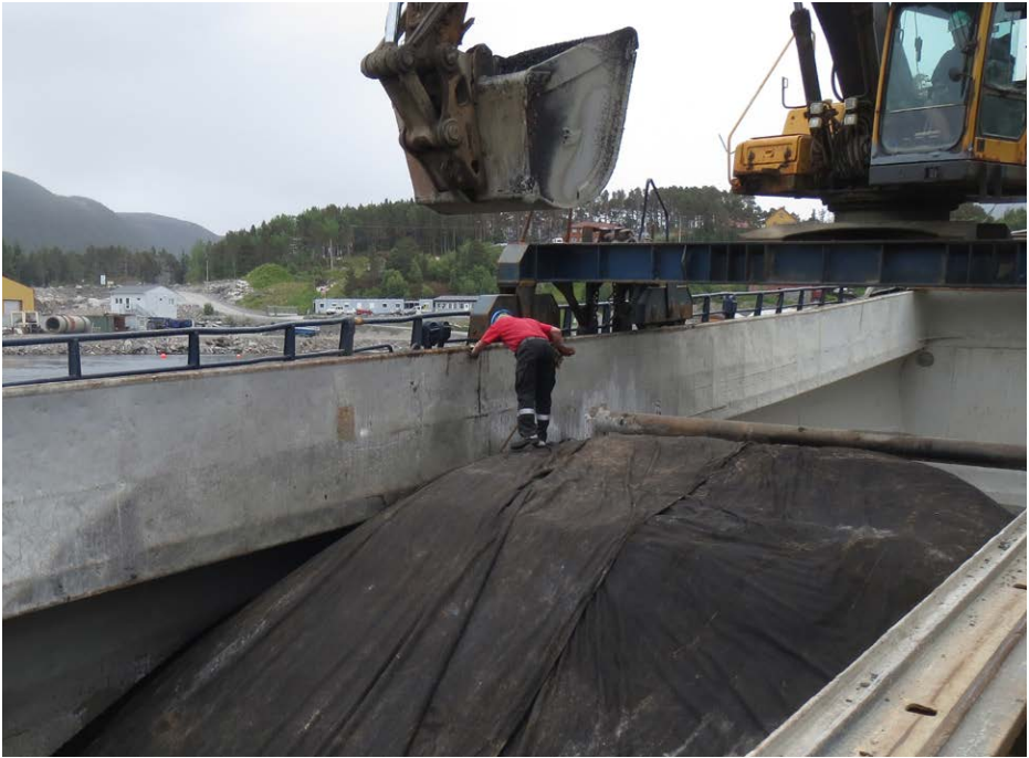
Figur 3: God tildekking hindrer varmetap.

For å unngå varmetap under transport må lasten tildekkes godt. Dersom det er mulig bør lasten tildekkes trinnvis for å forhindre varmetap underveis i lastingen.