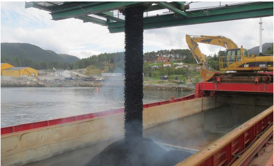
Figur 1: Stor fallhøyde gir avkjøling og separasjon.

Asfalt er en varm ferskvare. For å oppnå lang levetid på asfaltdekkene må asfalten være varm når den legges ut og komprimeres. Under transporten mellom asfaltfabrikk og utleggersted er det viktig å unngå varmetap, og også separasjon av asfaltmassen.