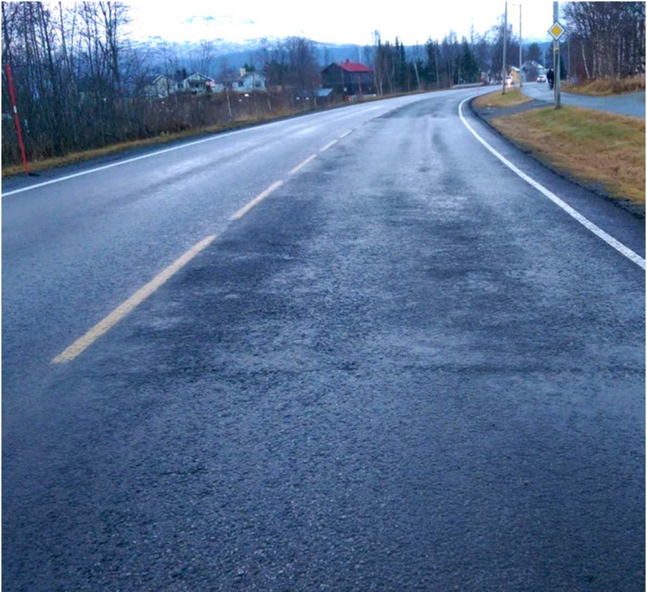
Figur 8: Kald asfalt gir dårlig asfaltdekke

God kommunikasjon mellom båt og utleggersted er viktig. Utleggerpersonell må gi beskjed til båtpersonell ved stopp og ved feltbytte, slik at lossingen kan stoppes og lasten kan dekkes til.