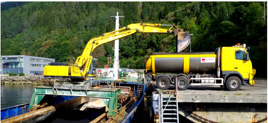
Figur 7: Bilen skal stå vinkelrett på båtsiden ved lossing.

Last aldri bare asfalt fra kantene, som har lavere temperatur, på samme bil. Klumper med kald asfalt og oppsamling av rester i lasterommet skal ikke legges ut, men returneres til asfaltfabrikken.