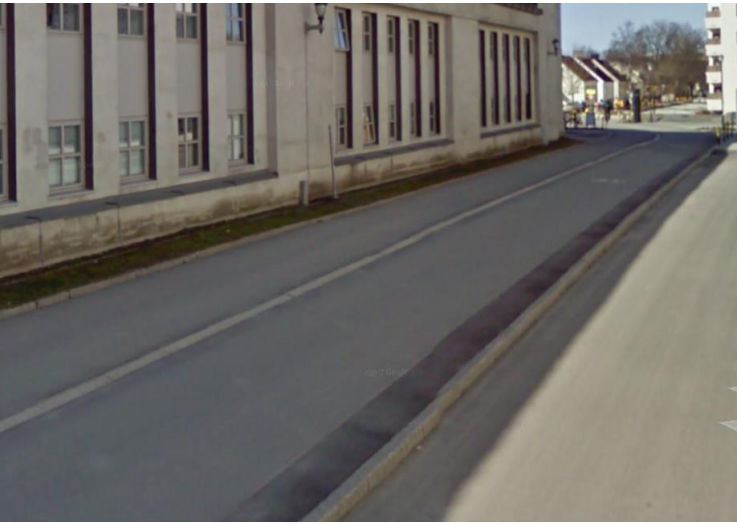
1. Sykkelveg med fortau: med høydeforskjell