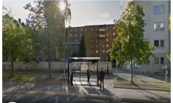
8. Busstopp Einar Tamberskjelves gate: fra sentrum