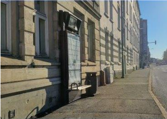
7. Busstopp Einar Tamberskjelves gate: mot sentrum