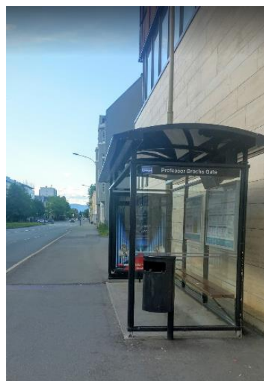
6. Busstopp Prof. Brochs gate før: mot sentrum