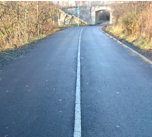
3. Sykkelveg med fortau: uten høydeforskjell