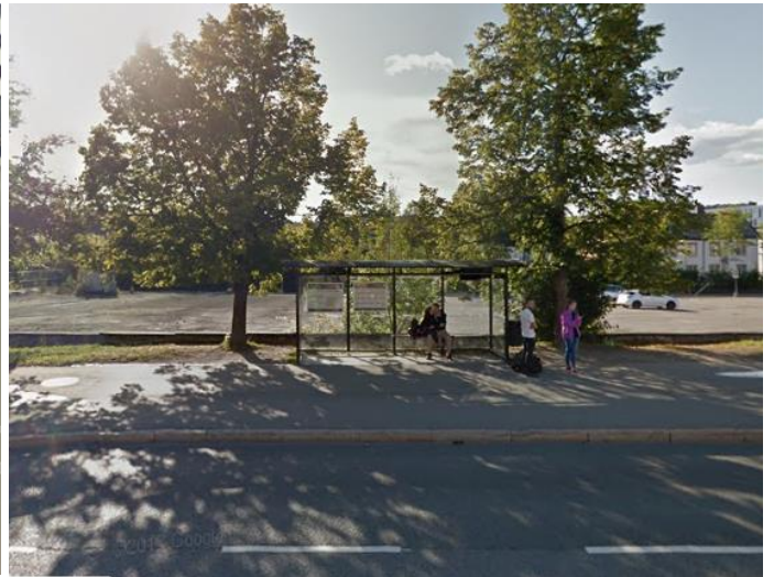
2. Busstopp Prof. Brochs gate før: fra sentrum