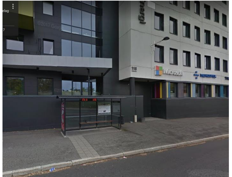
4. Busstopp Lerkendal stadion: fra sentrum