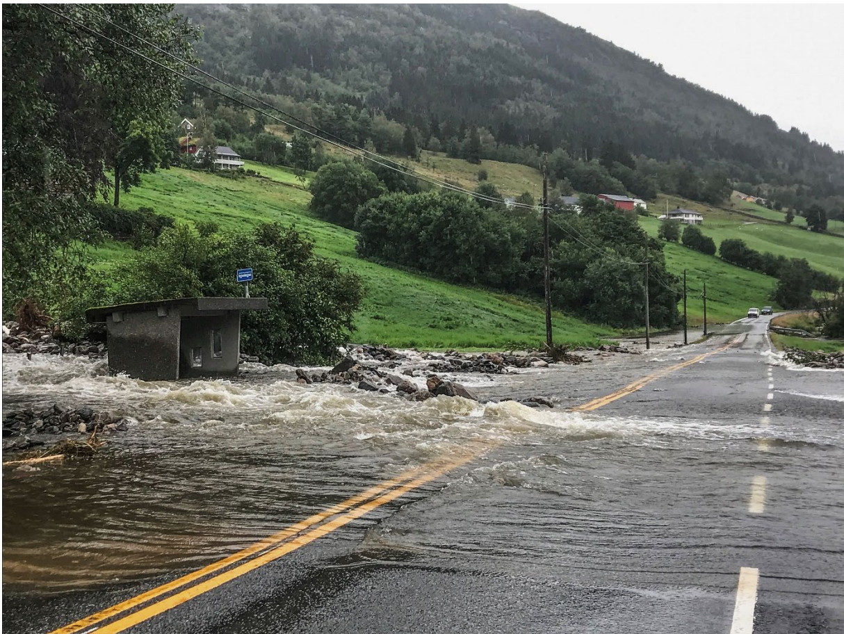
Flom i Jølster juli 2019