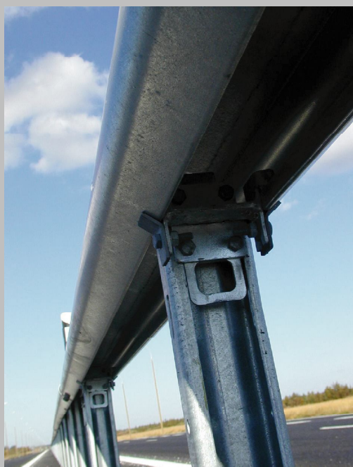
Z Ellips öppningsbar del