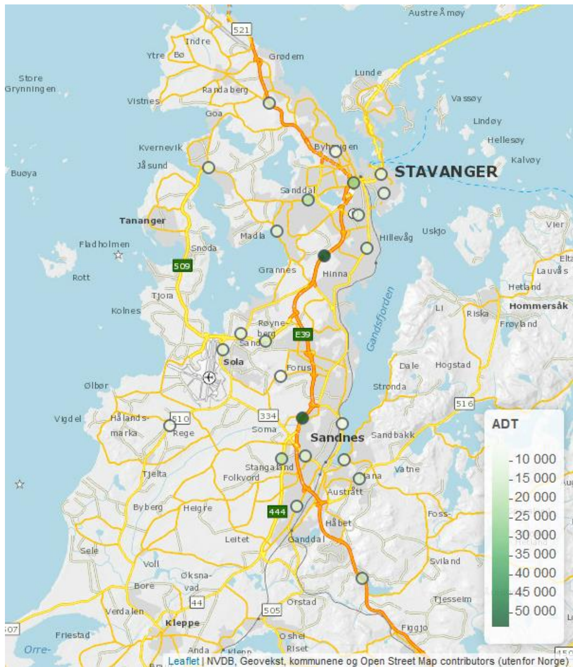
Figur 1. Trafikkregistreringspunktene og årsdøgntrafikk.

Kartet nedenfor viser plasseringen av trafikkregistreringspunktene.