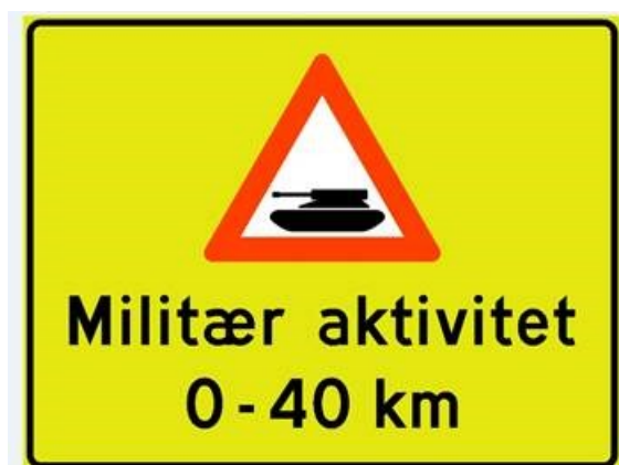
Figur 1 560 opplysningstavle Militær aktivitet

For å informere om militær aktivitet over en lengre strekning benyttes skilt 560 Opplysningstavle med gulgrønn bunnfarge. Skiltet kan også benyttes for å informere om militær transport langs veien eller flere kampsoner. Skilt 560 kan vise fareskilt «Militær aktivitet» og ha tekst «Militær aktivitet». Tekst på engelsk brukes ikke. Lengden på strekningen for øvingsområdet bør vises på skiltet.