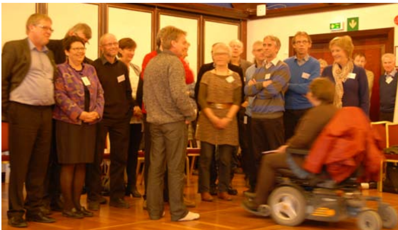
Fra de eldste...til de yngste

For å få et bilde av hvordan gruppa var sammensatt, skulle deltagerne stille opp etter alder, bosted (i, øst, vest og nord for Kvadraturen) og etter hvilken organisasjon eller sektor de representerte.