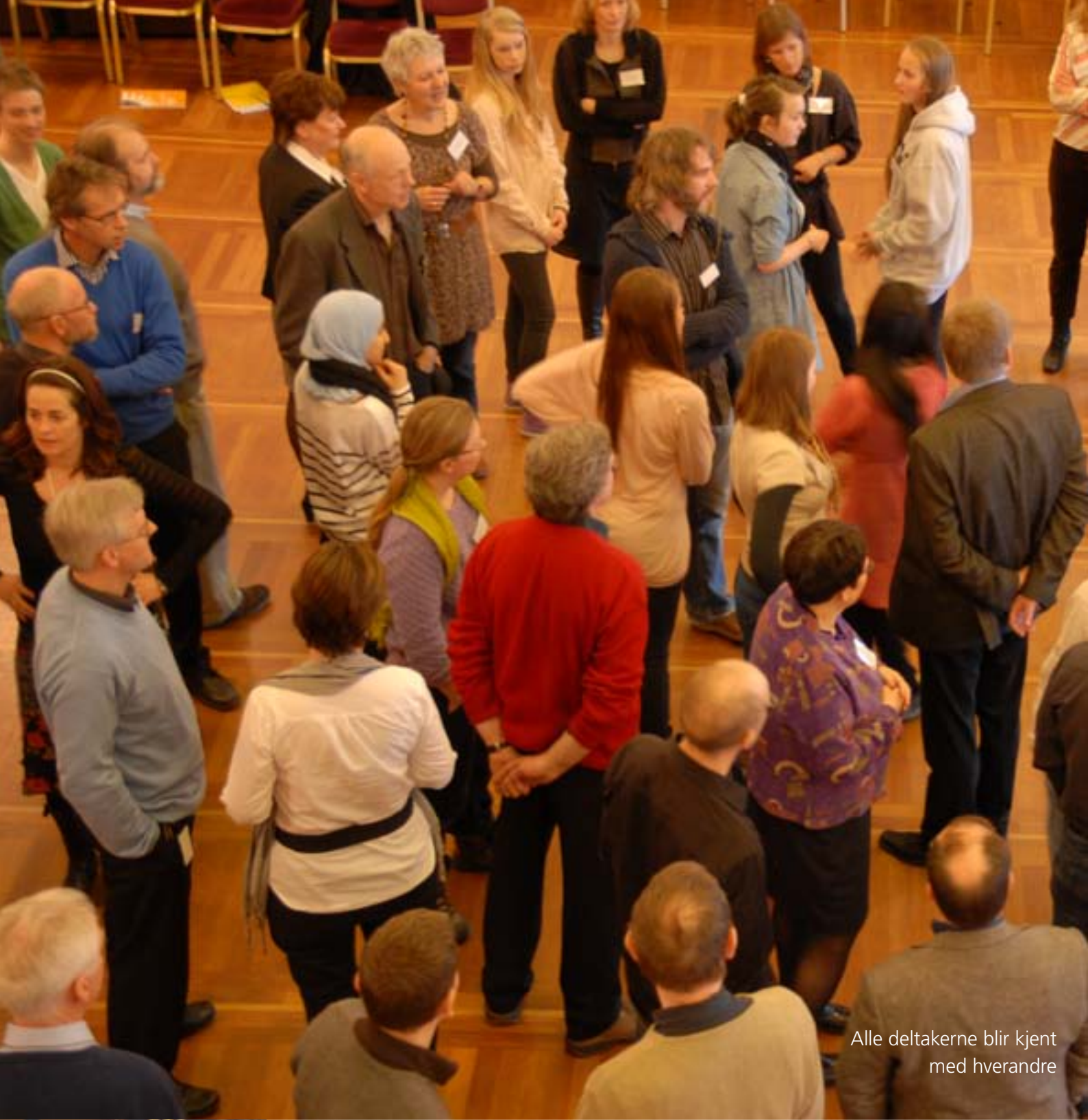
Alle deltakerne blir kjent med hverandre