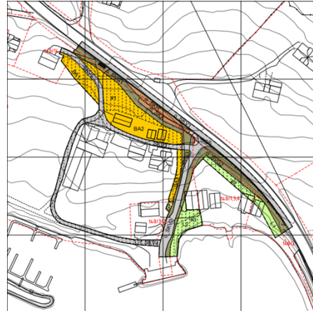
Arealplankart - Etter endring

Bakgrunnen for søknaden er å leggje til rette for betre siktforhold og trafikktryggleik som vart avdekkja i prosjekteringsfasen etter vedteken plan. Til den opphavlege søknaden vart det opplyst om følgjande endringar: