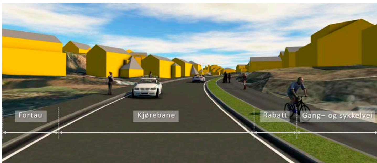
Prinsippskisse for opprustingen av Griniveien med gang- og sykkelveg og fortau. Planlagt ferdig våren 2025. (Illustrasjon: Norconsult / Statens vegvesen)

Statens vegvesen skal på vegne av Bymiljøetaten i Oslo (BYM) ruste opp og etablere sammenhengende gang- og sykkelveg langs Griniveien fra Røakrysset til Bærum grense. Den skal så koples sammen med gang- og sykkelvegløsningen som er bygd på Bærumssiden.