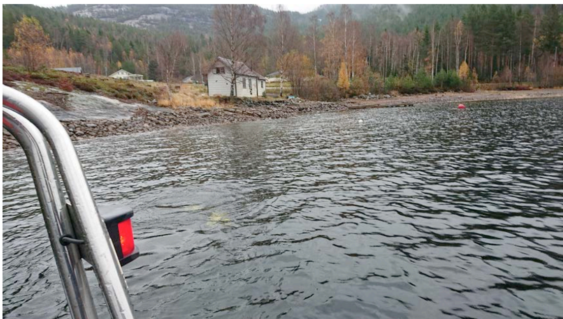
Fig 2. Dykker i vannet ved Vikbukta, sett mot øst.