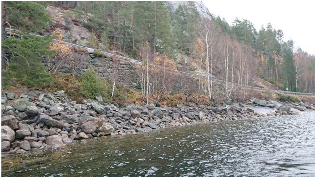
Fig 4. Tiltaksområdet ved Spjotkleiv sett mot sørøst. Dagens Rv. 41 med forstøtningsmur nær vannet.