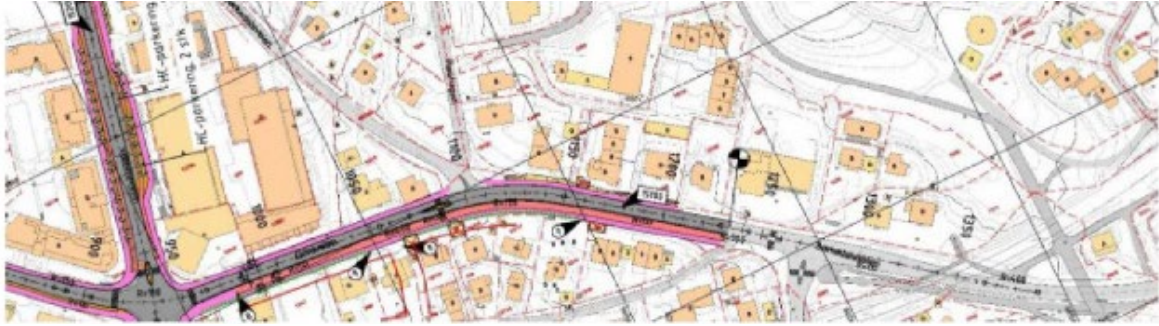
Østlig utbyggingsarbeid for Gatekonseptet