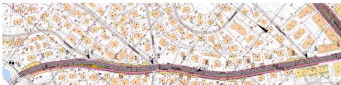
Vestlig utbyggingsarbeid for Gatekonseptet

Oslo bystyre vedtok 07.09.2022, sak 239/22 – Valg av konsept for Røkrysset at det i lys av finansieringssituasjonen i Oslopakke 3 ikke skulle arbeides videre med et tunnelkonsept på daværende tidspunkt, men at det i mellomtiden skulle igangsettes arbeid med forbedringer av kryssløsning i dagen, med trafikkreduserende tiltak. Denne løsningen «Gatekonseptet», er en videreutvikling av konsept 4, Vei i dagen