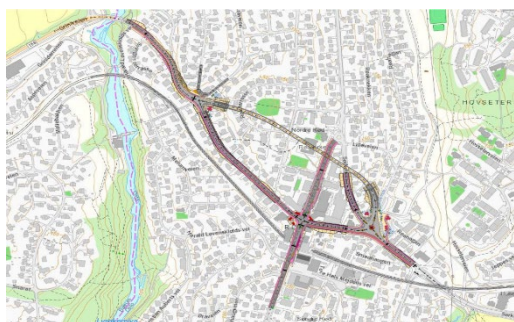
Konsept K3-1, kort tunnel

Bystyret vedtok i sak 208/20, 24.06.2020, «Bystyret ber byrådet legge frem en sak med valg av konsept for Røatunnelen i løpet av 2021». Bymiljøetaten fikk derfor i oppdrag i å lage en konseptvalganbefaling med anbefaling av konsept. Målet med utredningen er å komme frem til et bedre beslutningsgrunnlag for valg mellom konsept K3-1 kort tunnel øst-vest og K3-3 lang tunnel øst-vest. Konsept K4 Vei i dagen er tatt med i utredningen for å ha et godt sammenlikningsgrunnlag.