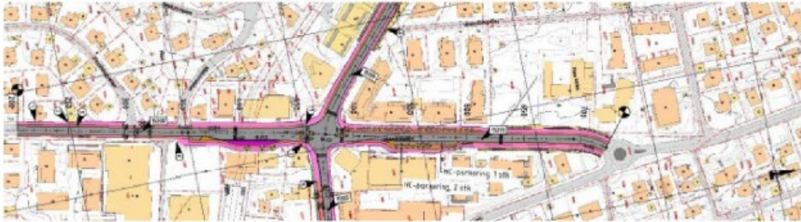
Sørlig og nordlig utbyggingsarbeid for Gatekonseptet