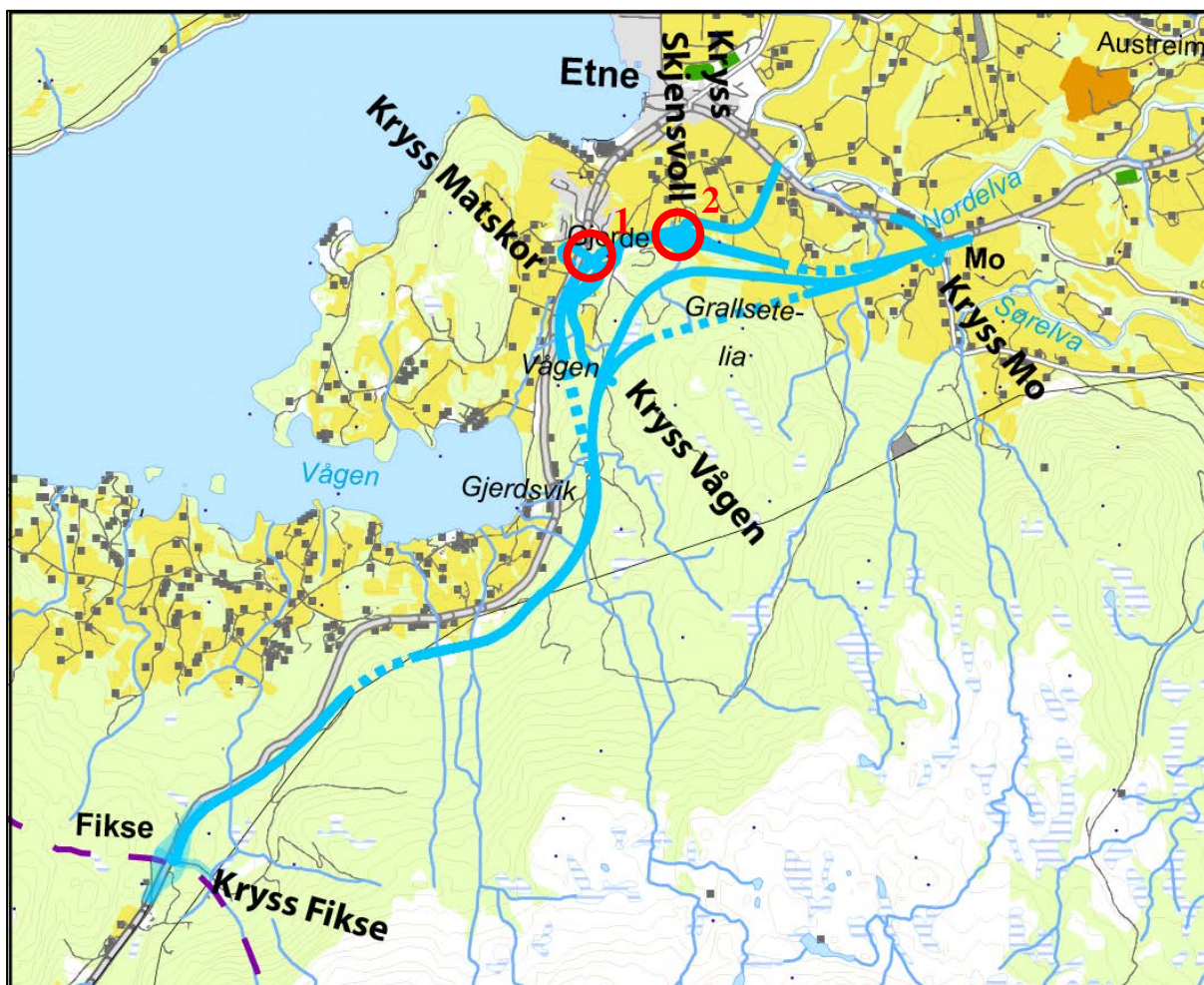
Figur 3, strekningen Fikse - Mo

I anbefalt løsning er det ikke konflikt med bolig, mens en nordre trase (ØA-I-c) gir konflikter med boliger/gårdsbruk.