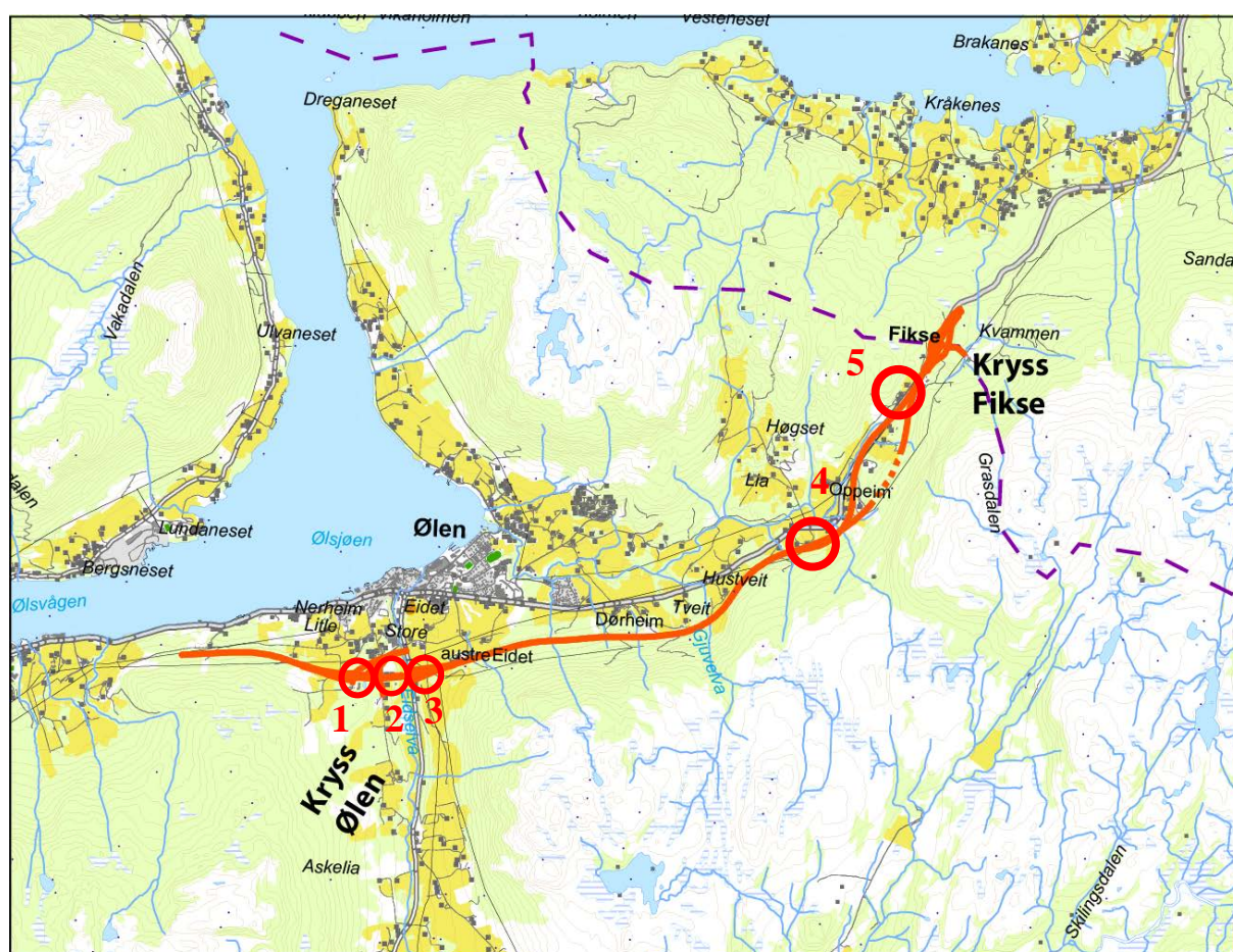
Figur 2, strekningen Ølensvåg - Fikse

I anbefalt alternativ vil det være konflikt med fem boliger og et næringsbygg. I en løsning med delt kryss ved Ølen og tunnel ved Oppeim vil det være konflikt med fire boliger.