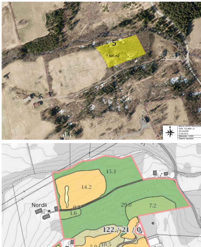
Figur 2: Arealer som har blitt vurdert som oppdyringsarea ved Gullen, gnr./bnr. 122/21, det nederste bildet er utsnitt fra norske gaardskart