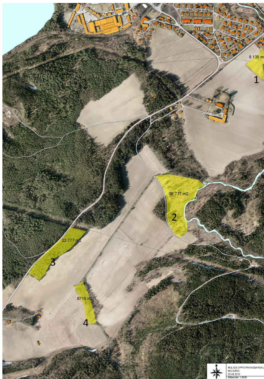
Figur 1: Arealer som har blitt vurdert på Moe gård gnr/bnr 148/1