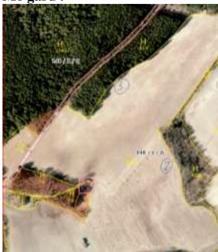
Figur 1: Område 1, 2 og 3 på Mo gård