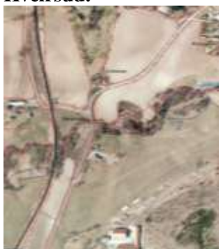
Figur 4: Områder ved Kvelrsud