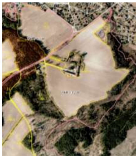
Figur 2: Område 4 og 5 på Mo gård