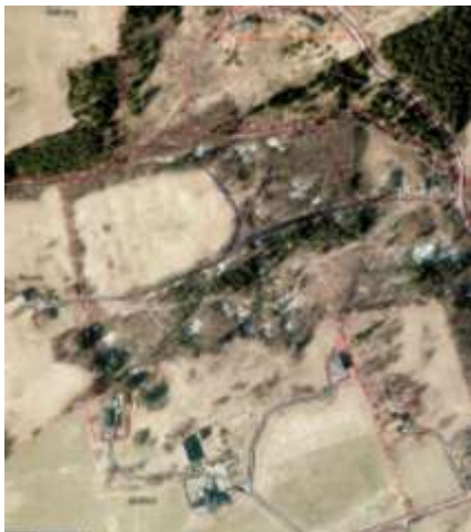
Figur 5: Gullen

Bakgrunnen for å ta områdene inn i reguleringsplanen vil være for å ha juridisk hjemmel for å ekspropriere, noe som i utgangspunktet ikke er ønskelig.