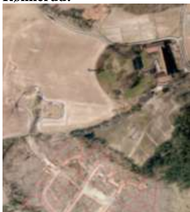
Figur 3: To mulige områder ved Rønnerud