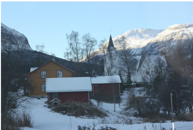
Vang kirke og prestegard