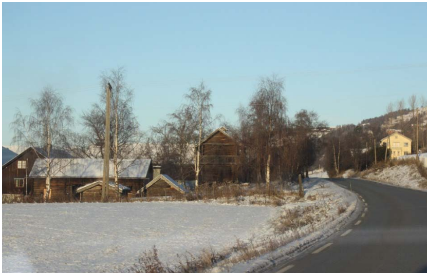
gardstun inntil E16