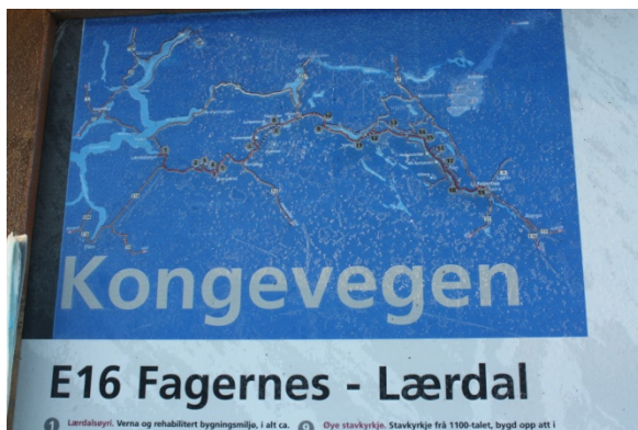
Fra skilt på rasteplass i Lomen

Den gamle kongevegen "Bergenske Hovedvej", er delvis bygget på enda eldre veggrunn, men ble åpnet for kjørende i 1793. Viktig veg mellom Oslo og Bergen.