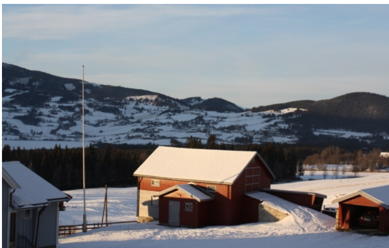
fra Rogne mot Volbu

I Rogne (fra Melby til Moane) er det en del funn av gravminner og det er også gjort funn av bosetnings/-aktivitetsområder. Området har potensiale for funn av bosetningsspor, og kan være et område med stor tidsdybde. Det sørvendte kulturlandskapet i Volbu har både bosetningsspor, kirkested og kullframstillingsanlegg/jernvinne. Kulturlandskapet i Høre har stor tidsdybde, det er gjort funn av bosetningsspor, mange gravminner og et til dels særprega bygningsmiljø med stavkirken som et viktig kulturminne.