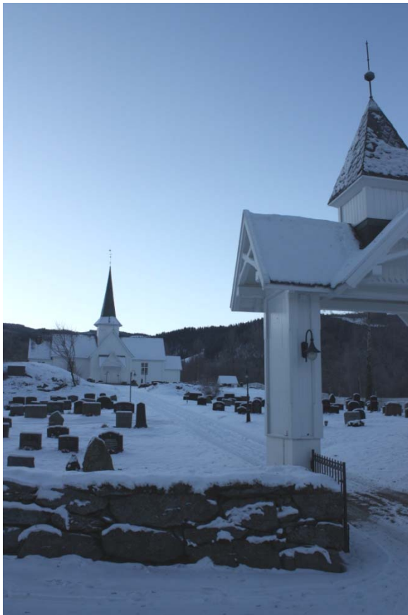
Strand kirke, Nord-Aurdal