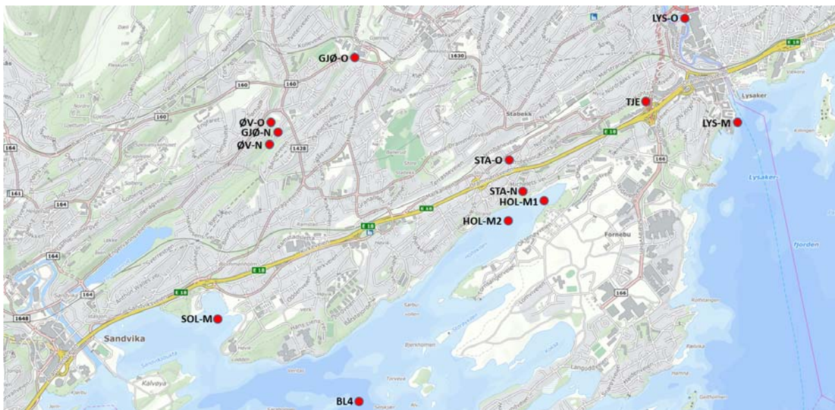
Figur 3. Prøvetakingsstasjoner for resipientovervåking i ferskvann og marine områder.

Overvåkingen vil omfatte følgende ferskvannsføremøster: Lysakerelva, Gjønnnes-/Nadderudbekken, Øverlandselva, Stabekken og Tjernsmyr. De marine resipientene som skal overvåkes er: Holtekilen, Solvika, marin sone ved utløpet av Lysakerelva samt supplerende undersøkelser i Bærumsbassenget. De aktuelle resipientene er vist i figur 3. Revidert utbyggingsplan for E18 Lysaker – Ramstad må forventes å gi svært små eller ingen effekter på Lysakerelva. Overvåkingen i Lysakerelva utføres derfor som et samarbeid med Fornebubanen.