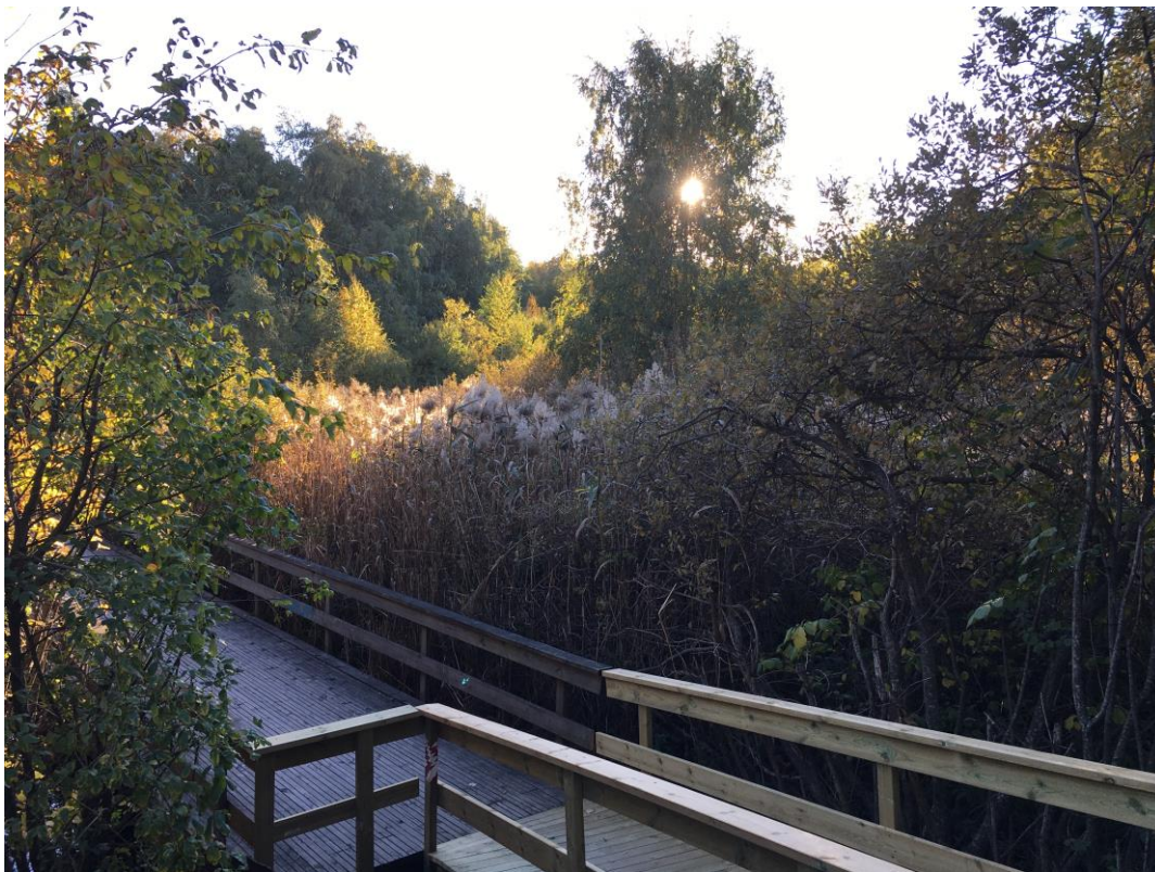
Tjernsmyrtjern (Lysakertjern) på Lysaker sett fra gangstien i øst 3.10.2018.

NiB står gjerne tilgjengelig som rådgivere om vårt forslag realiseres. Det gjør også Norsk Zoologisk Forening vedr. salamanderne og Norsk Ornitologisk Forening vedr. fuglene.