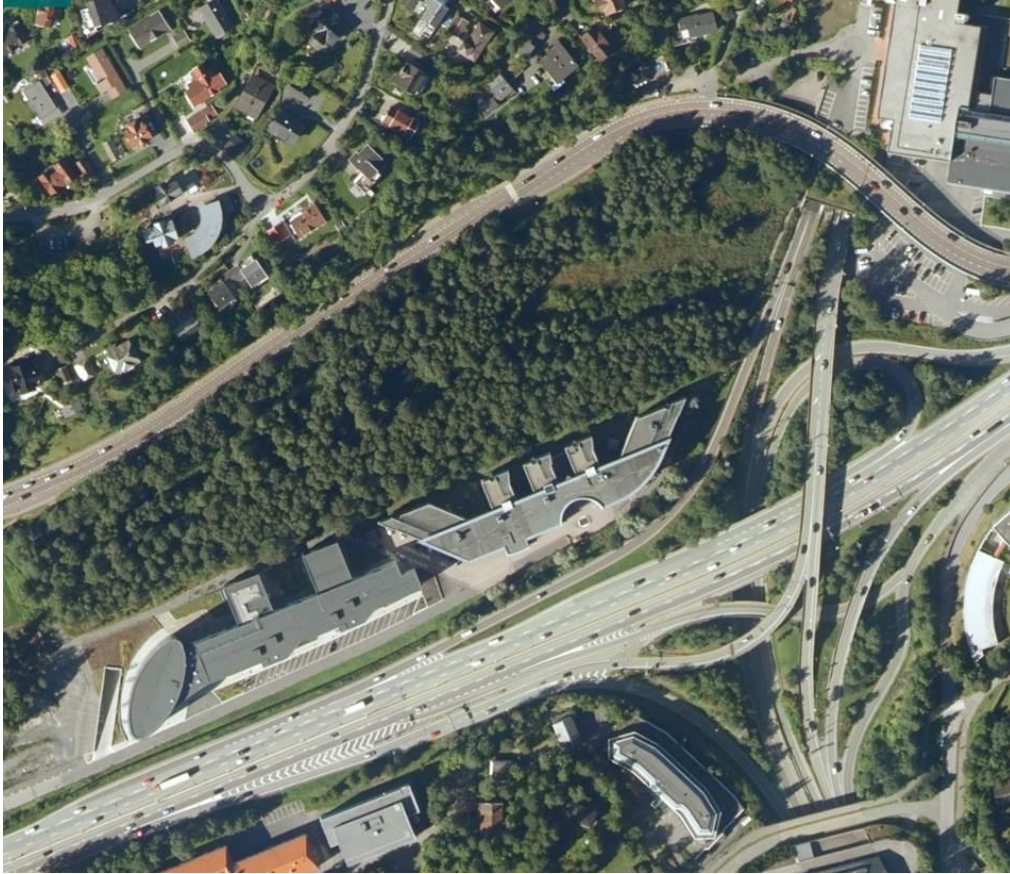
Tjernsmyrtjern (Lysakertjern) på Lysaker. Legg merke til at åpent vannspeil er borte og enga har grodd til med bjørkekratt.