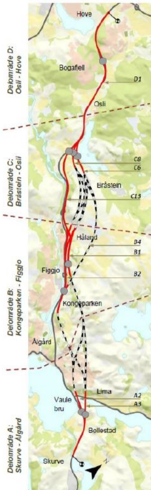
Figur 1 Oversikt over planområdet delområder

For mer utdypende beskrivelse vises det til hovedhefte for kommunedelplan med KU.