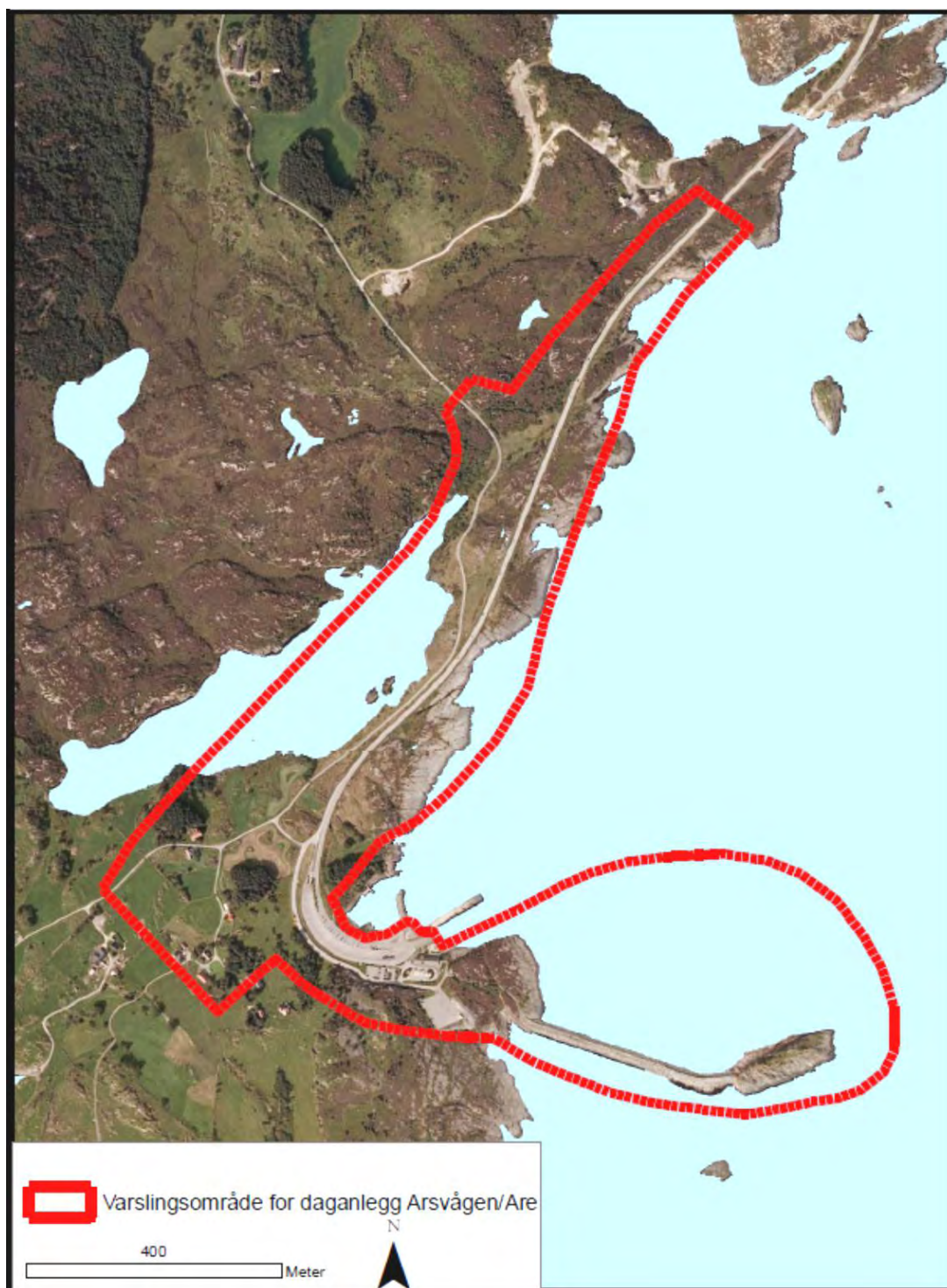
Figur 3. Varslingsområde for daganlegg ved Arsvågen / Are i Bokn kommune

Det skal etableres tunnelportal, tilknytning til dagens E39 og to-plankryss. Områder for masseutfylling er i tråd med vedtatt kommunedelplan, men det skal også vurderes andre områder for massebruk i Bokn kommune. Dagens fergeteie er planlagt beholdt av beredskapshensyn.