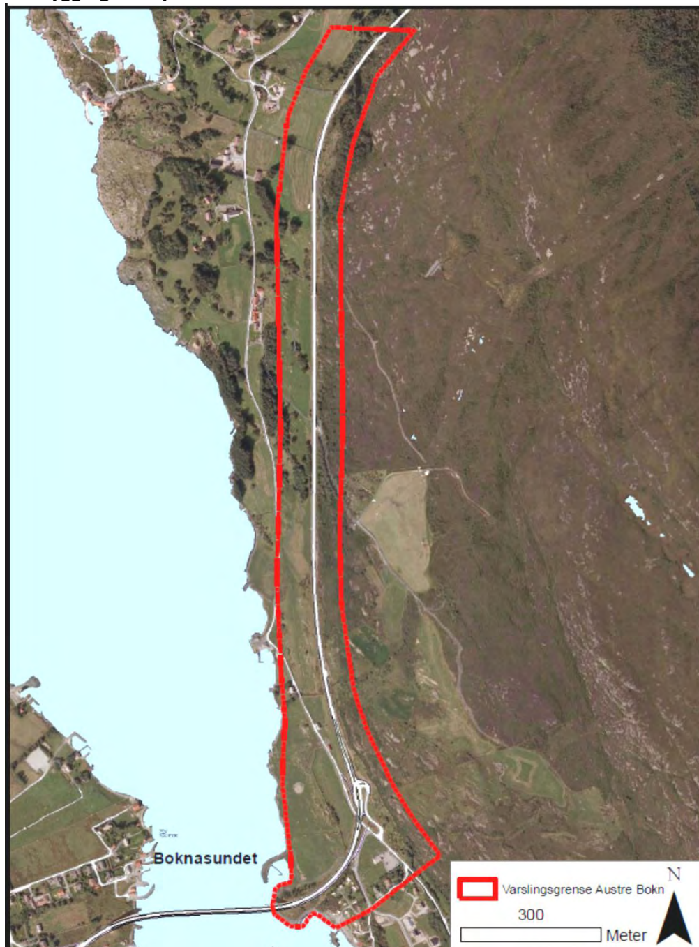
Figur 5. Varslingsområde for ombygging av kryss ved Knarholmen

Krysset forslås bygd ut til et forenklet to-plankryss, og det forslås å ta med forbikjøringsfelt nordover.