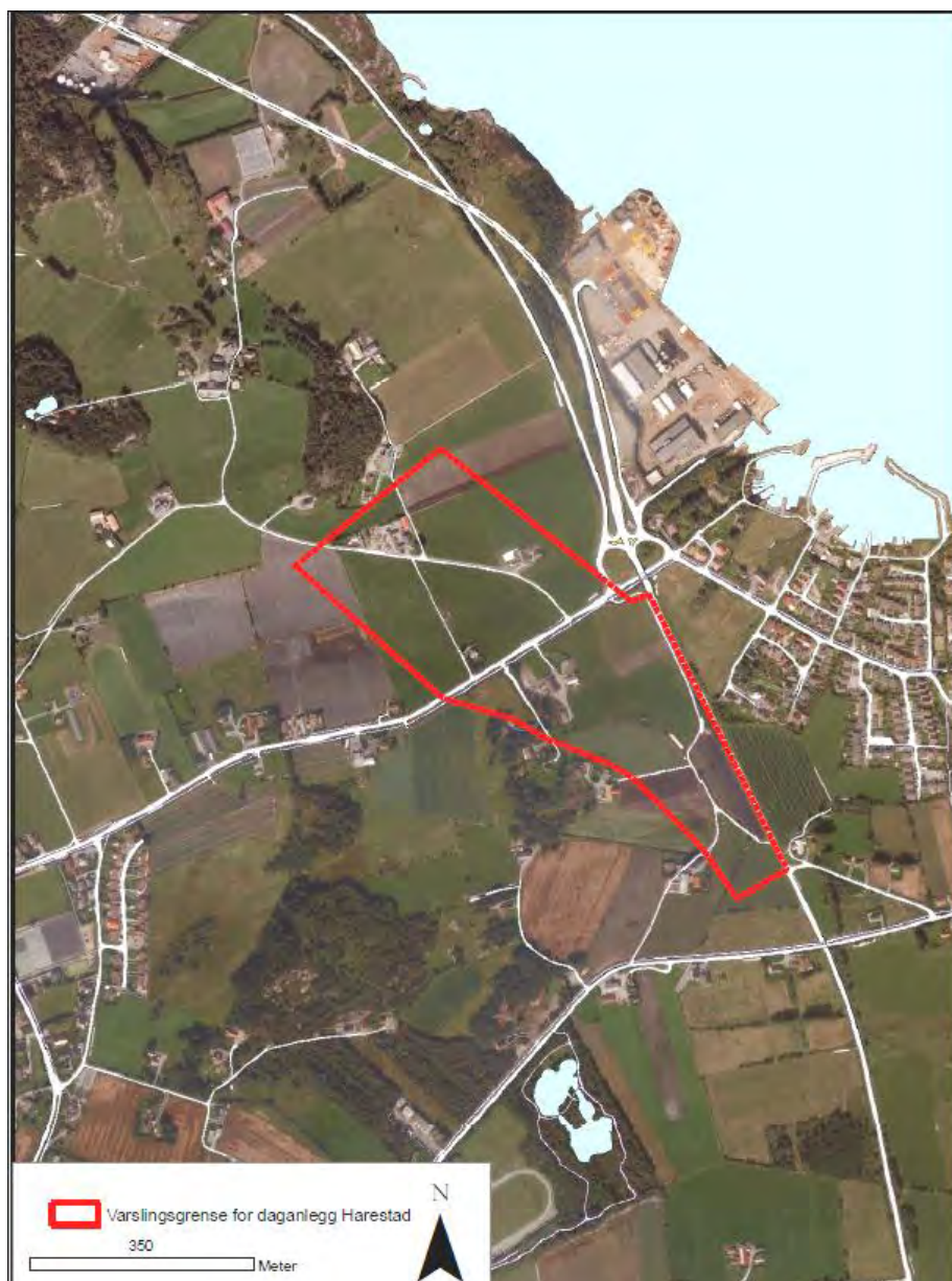
Figur 2. Varslingsområde ved Harestad

I denne planen skal påhuggsområdet for tunnelen med tilstøtende arealer fastsettes.