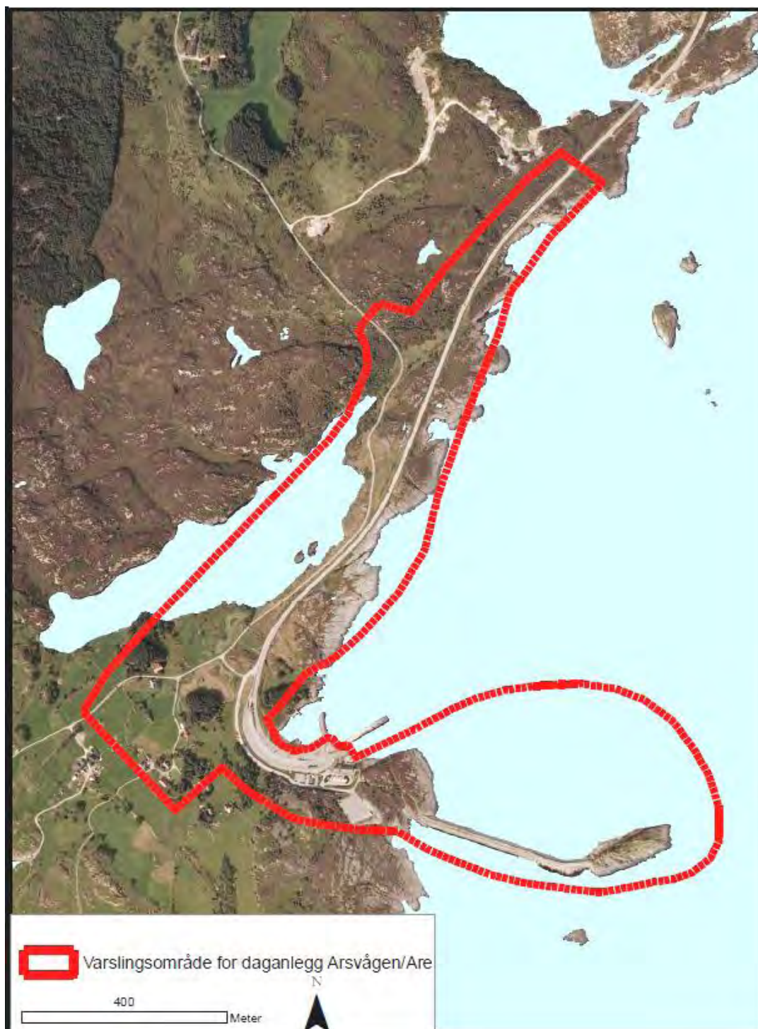
Figur 6. Varslingsområde for daganlegg ved Arsvågen / Are i Bokn kommune

Det skal etableres tunnelportal, tilknytning til dagens E39 og toplankryss. Områder for masseutfylling er i tråd med vedtatt kommunedelplan, men det skal også vurderes andre områder for massebruk i Bokn kommune. Dagens ferjeleie er planlagt beholdt av beredskapshensyn.