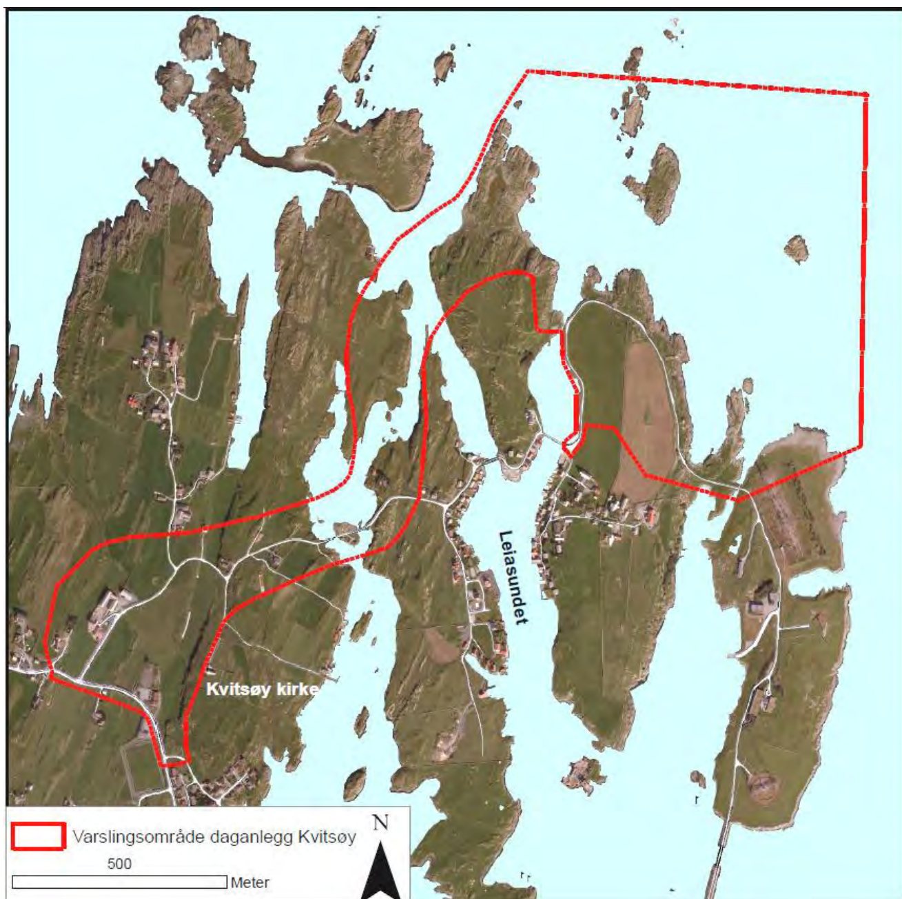
Figur 4. Varslingsområde for daganlegg på Kvitsøy

Utfyllingsområdet i nordøst er vist med ytteravgrensning som i vedtatt kommunedelplan. Utfylt område vil bli betydelig mindre enn ytteravgrensningen. Alternative utfyllingsområder skal vurderes.