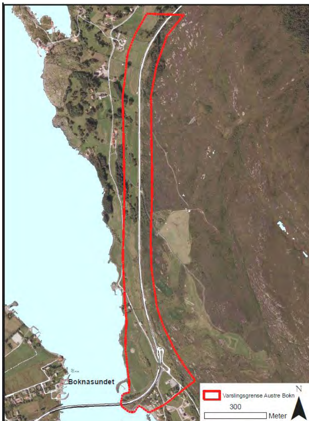
Figur 8. Varslingsområde for ombygging av kryss ved Knarholmen

Krysset foreslås bygd ut til et forenklet toplanskryss, og det foreslås å ta med forbikjøringsfelt nordover.