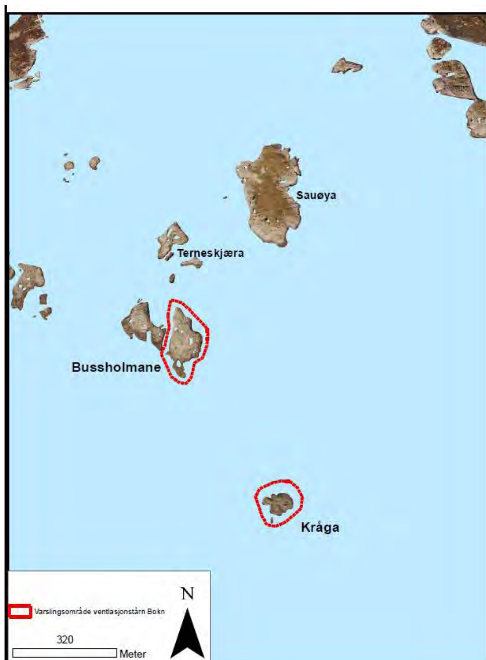
Figur 5. Varslingsområde for ventilasjonstårn i Bokn

Varslingsområdet tar høyde for 2 alternative plasseringer av ventilasjonstårn; a) på Kråga slik som i vedtatt kommunedelplan, b) på Bussholmane lenger mot nordvest.