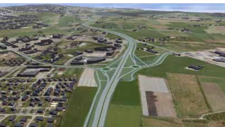
Alt. 1 Finnestadkrysset, sett mot sør

På åpen kontordag blir det anledning til å snakke med saksbehandlere i Statens vegvesen på tomannshånd, for å få mer detaljert informasjon om forhold som berører den enkelte, og det blir samtidig en god anledning til å gi oss tilbakemeldinger og informasjon om forhold av betydning for løsninger i prosjektet. Det vil også være representanter fra Randaberg og Stavanger kommune til stede.