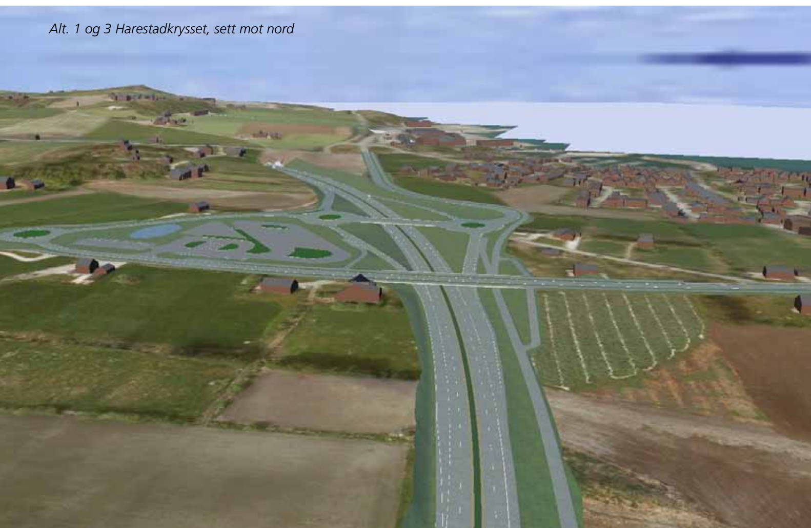
Alt. 1 og 3 Harestadkrysset, sett mot nord