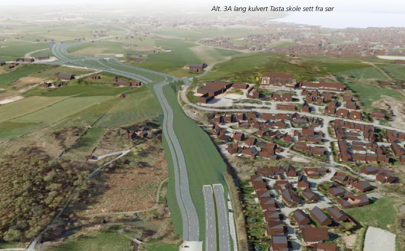
Alt. 3A lang kulvert Tasta skole sett fra sør