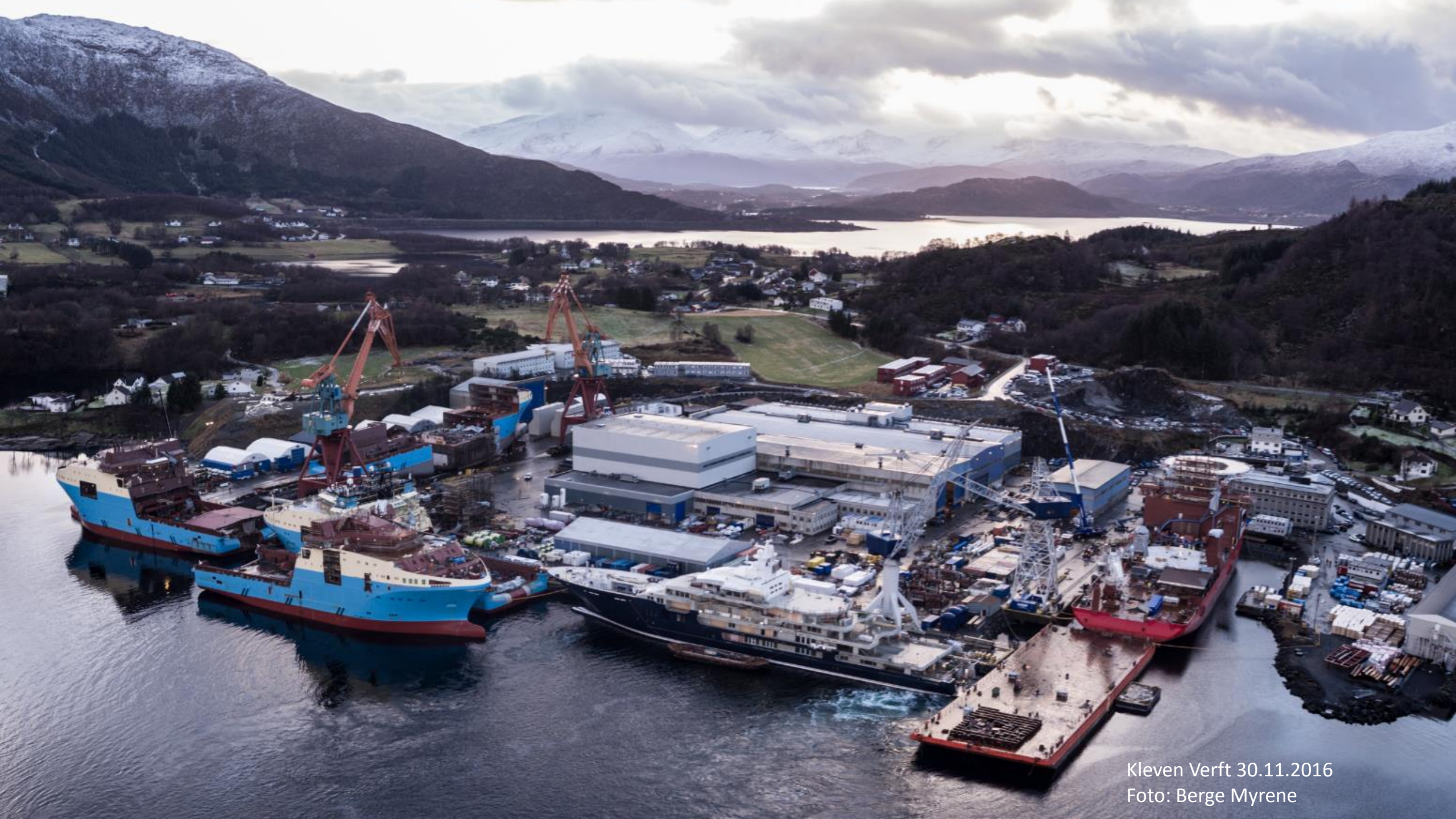
Kleven Verft 30.11.2016