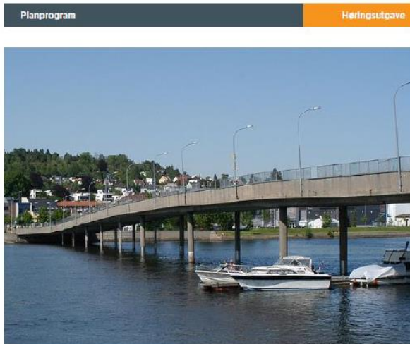
Rv. 282 Holmen bru