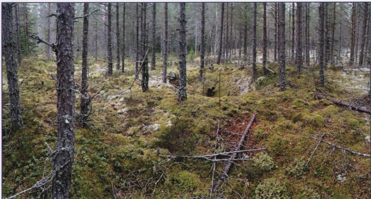
Id 215899 Kullgrop. Bildet er tatt mot nordvest.

Kullgrop med rund form som måler 7,5 meter i diameter inklusiv voll. Voll måler 2 meter i bredde og høyde opp til 20cm i nord. Indre form er rund og måler omtrent 5 meter i diameter. Bunnformen er konkav og dypeste mål er 130 cm. Det ble påvist 20 cm kull med jordbor fra strukturens senter. Kullgropa ligger i flatt terreng kledd i tett ung furuskog. Skogsbilveg og plangrense ligger 7 meter øst for strukturen.