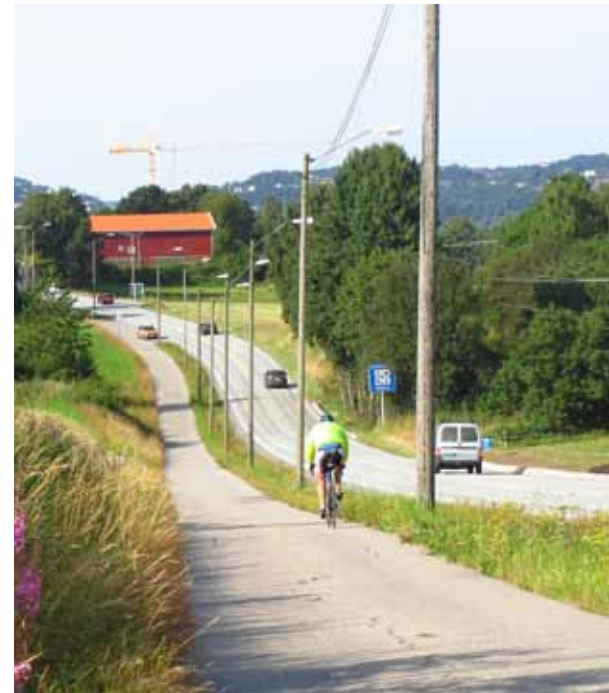
Fra dagens veg til Kjevik.

Tidspunkt for byggestart avhenger av finansiering og politiske beslutninger.