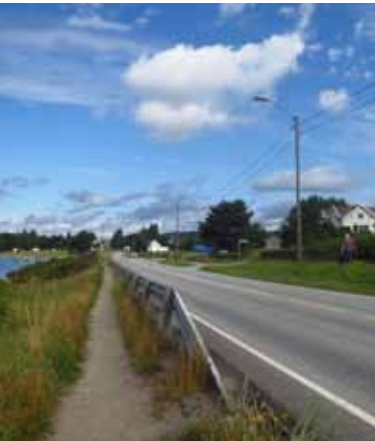
Fra Hamresanden.