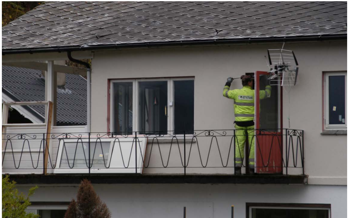
Å skifte vindu kan være ett av mange tiltak for å redusere støyen fra ny veg.

Det er tre konsultentselskap som deler på oppdraget med planleggingen av dette. Det vil pågå besøk til de aktuelle huseiere i tiden framover. Det er snakk om 3-400 boenheter fra Loddefjord til Kolltveit.