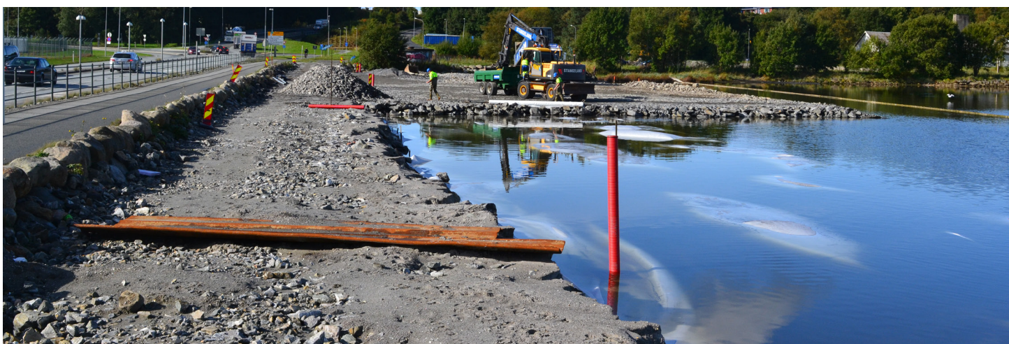
13-1911 grafisk.senter@vegvesen.no

Statens vegvesen er i full gang med å klargjøre området rundt Sømmevågen for vegbygging. Sommeren 2014 starter bygging av et toplanskruss i Sømmevågen vest og utvidelse av Tanangerveien mellom Sømmevågen og Sømme. Flyplassvegen skal utvides til firefelts veg på strekningen mellom Sentrumsvegen og fram til rundkjøringen ved Nordsjøvegen i sør.