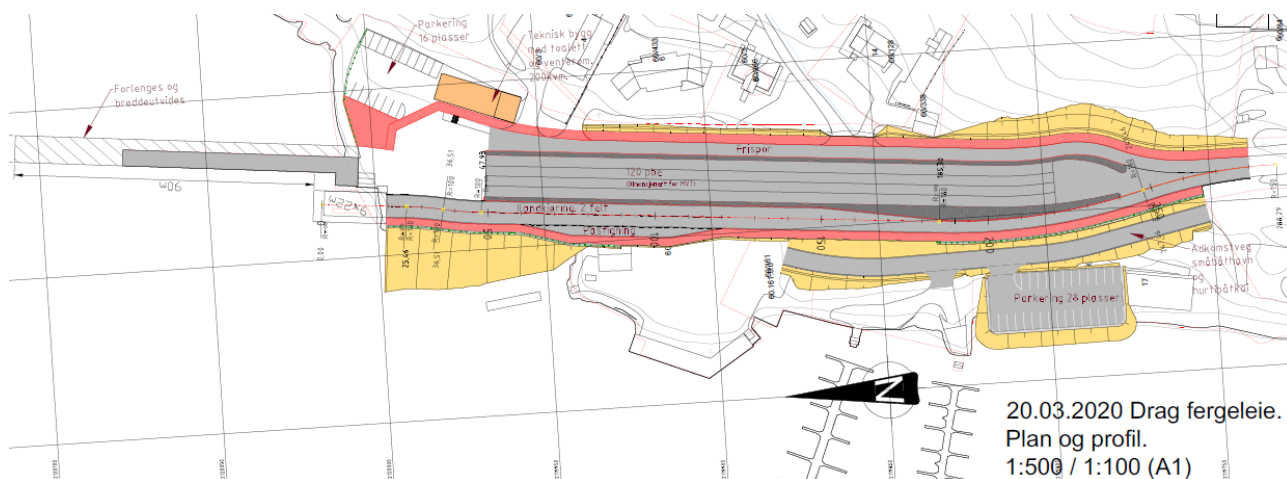
Figur 1: Planområdet med planlagte tiltak.

Det planlagte tiltaket er å tilrettelegge fergekaien for lavutslippsferger. Dette medfører en endring i dagens fergekai. Det planlegges 2 parkeringsplasser, 4 oppstillingsfelt for kjøretøy samt et frispors, teknisk bygg med venterom og WC, autopasspassering og to ilandkjøringsfelt. Det er i tillegg planlagt en separat atkomstvei til småbåthavn, hurtigbåthavn og parkeringsplassen. De planlagte tiltakene vises i figur 1.