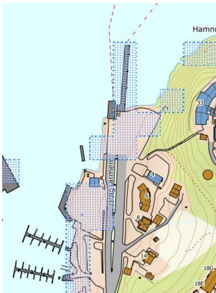
Figur 3: Aktsomhetsområder for flom.

Planområdet vurderes å være lite sårbart for flom i vassdrag med bakgrunn i hvor i planområdet tiltakene (det tekniske bygget med tilhørende venterom og WC) plasseres. Tiltaket er en fergekai som må plasseres hensiktsmessig i forhold til bruken av tiltaket.