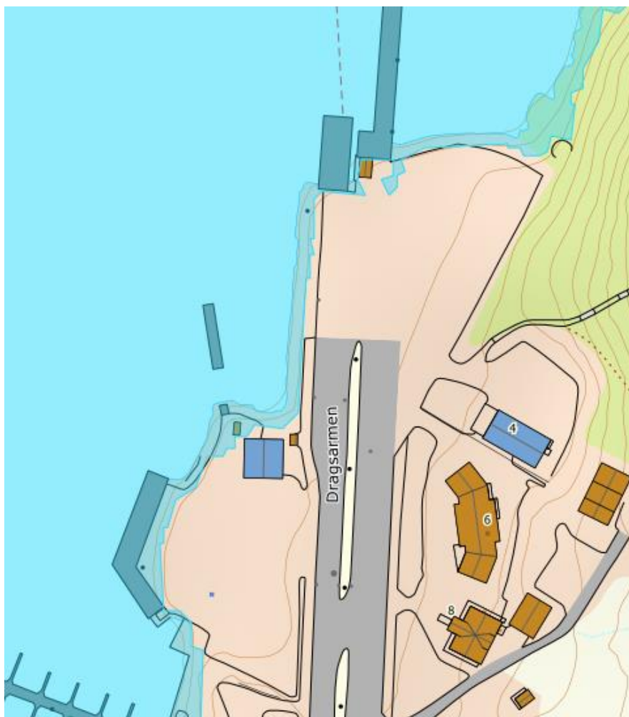
Figur 4: Planområdet 20 års stormflo med dagens havnivå. Hentet fra DSBs kartinnsynsløsning.

Med forbehold om at tiltak dimensjoneres for å håndtere/ tåle vannmengdene ved en eventuell stormflo vurderes planområdet som lite til moderat sårbart for stormflo. Denne vurderingen er gitt med bakgrunn av at tiltaket er et fergeleie og at konstruksjonen må plasseres på gitt område og at konstruksjonen tåler belastning av en eventuell stormflohendelse.