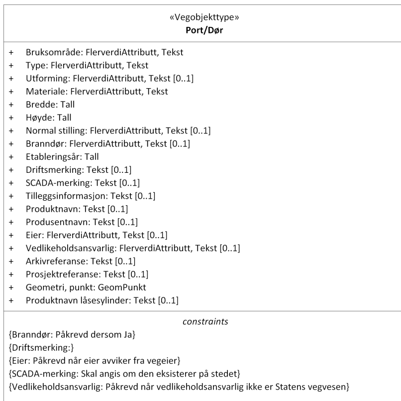
Figur 1: UML-skjema med betingelser