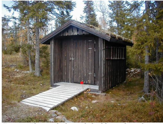
Figur 4: Eksempel på et enkelt eldre toalettanlegg med et toalett. Punkt for registrering av geometri markert med rød prikk (midt på dør)

Type: Tørrklosett Avløp til: Antall klosett: 1 Eier: Statens Vegvesen Vedlikeholdsansvarlig: Statens Vegvesen Privat avtale: Nei Tilrettelagt bevegelseshemma: Nei