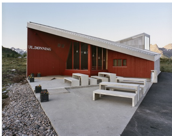
Figur 3: Eksempel på toalettanlegg i privat bygg

Type: Vannklosett Avløp til: Lukket tank Antall klosett: 3 Eier: Privat Vedlikeholdsansvarlig: Privat Privat avtale: Ja Tilrettelagt bevegelseshemma: Ja