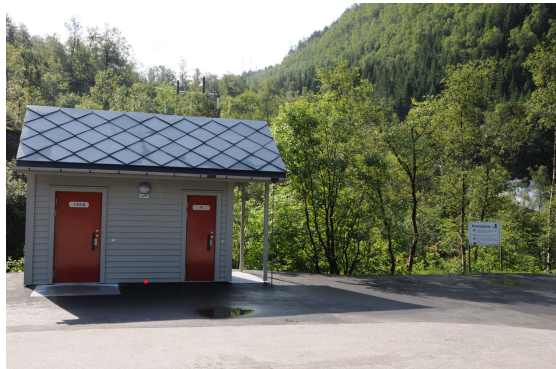
Figur 4: Eksempel på et toalettanlegg med to toaletter. Punkt for registrering av geometri markert med rød prikk (midt mellom dørene)

Type: Vannklosett Avløp til: Lukket tank Antall klosett: 2 Eier: Statens Vegvesen Vedlikeholdsansvarlig: Statens Vegvesen Privat avtale: Nei Tilrettelagt bevegelseshemma: Ja