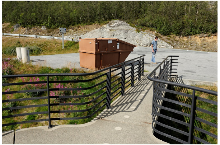
Avfallscontainer på rasteplass.