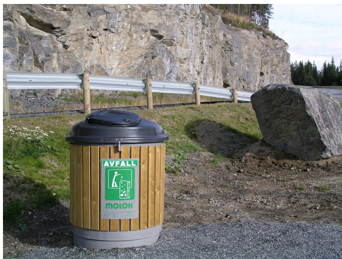
Molok på rasteplass.

Antall: 1 Type: Molok Tømmebehov: 1 Volum: 400