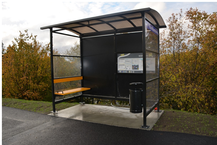
Avfallsdunk plassert i et leskur.

Antall: 1 Type: Avfallsdunk Tømmebehov: 1 Volum: 12