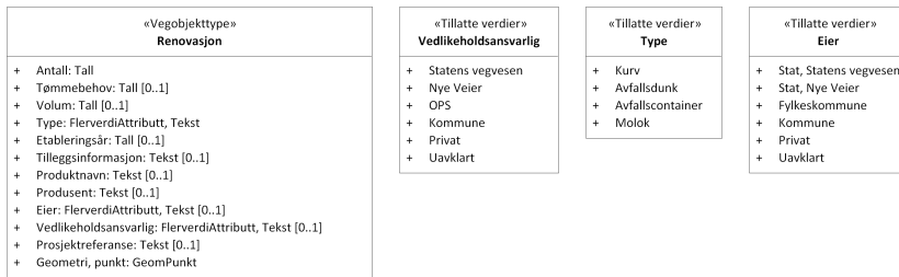
Figur 2: UML-skjema tillatte verdier