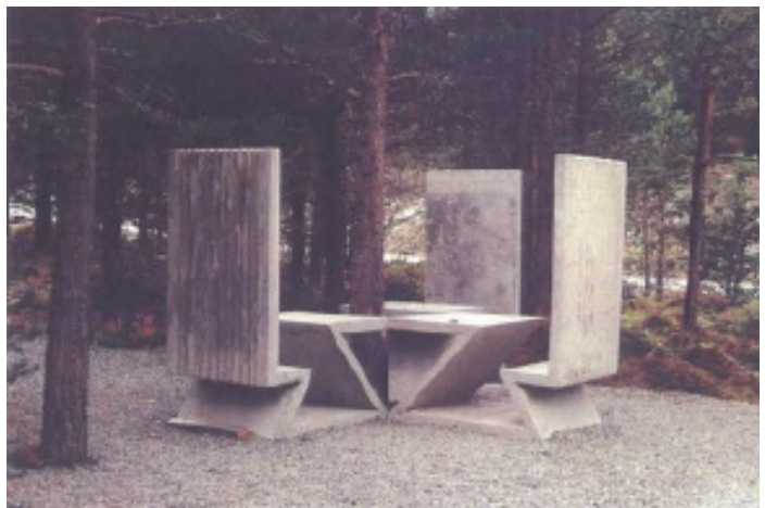
Sittegruppe, bord/stoler av materialtype betong