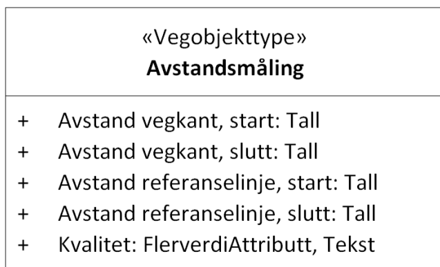
Figur 1: UML-skjema Avstandsmåling